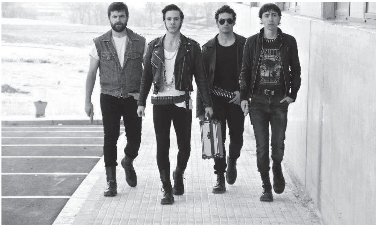
El grup Obeses al complet

música va créixer i des de llavors no ha parat d'estudiar-la. Remarca la seva inquietud per la novetat musical, l'atracció vers aquesta disciplina artística i com de propera la viu. La música, ens explica, li permet expressar les coses que sent i allò que vol comunicar.