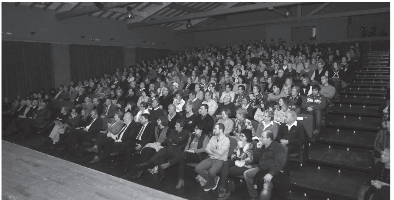
La remodelada sala polivalent La Canal el dia de la inauguració de les obres de reforma

Política (02-11-14): Acte central de la campanya per la consulta del 9N organitzat per la secció local de l'ANC.