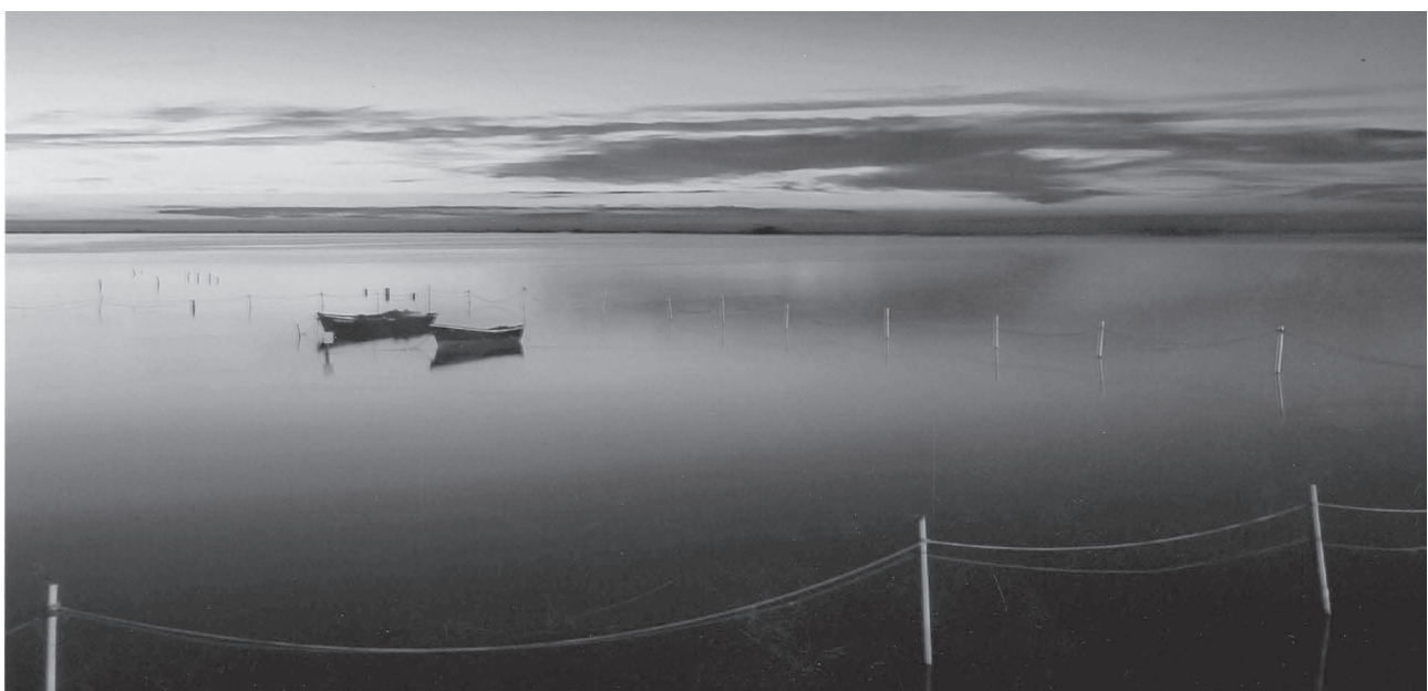
Concurs "Castell d'Or". Primer Premi Local

Festes (08-03-14): Rua de carnaval pels carrers del poble.