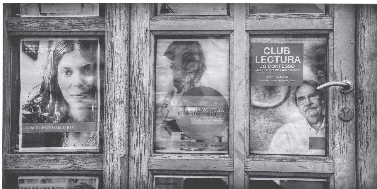
Concurs "Castell d'Or". Primer Premi Tema Tona

Esbarjo (28-12-14): Quina popular de Nadal a benefici del CB Tona (sala polivalent La Canal).