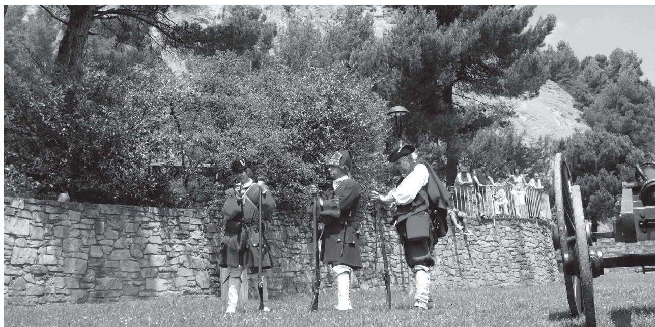
Recreació històrica dels fets de 1714. Els Miquelets de Catalunya al parc de les Feixetes

Per evitar actituds incíviques i la destrossa de mobiliari urbà, l'Ajuntament de Tona ha enge-