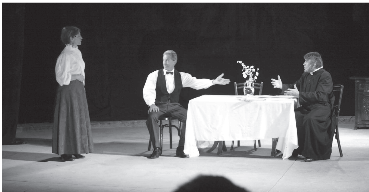
Estrena al parc de les Feixetes de l'obra La roda i el foc , escrita per Amadeu Lleopart, per part del grup Tona '78 Talia

Cultura (07-09-14): Estrena de l'obra teatral La roda i el foc , escrita per Amadeu Lleopart i interpretada pel grup Tona '78 Talia. Acte del Tricentenari (parc de les Feixetes).