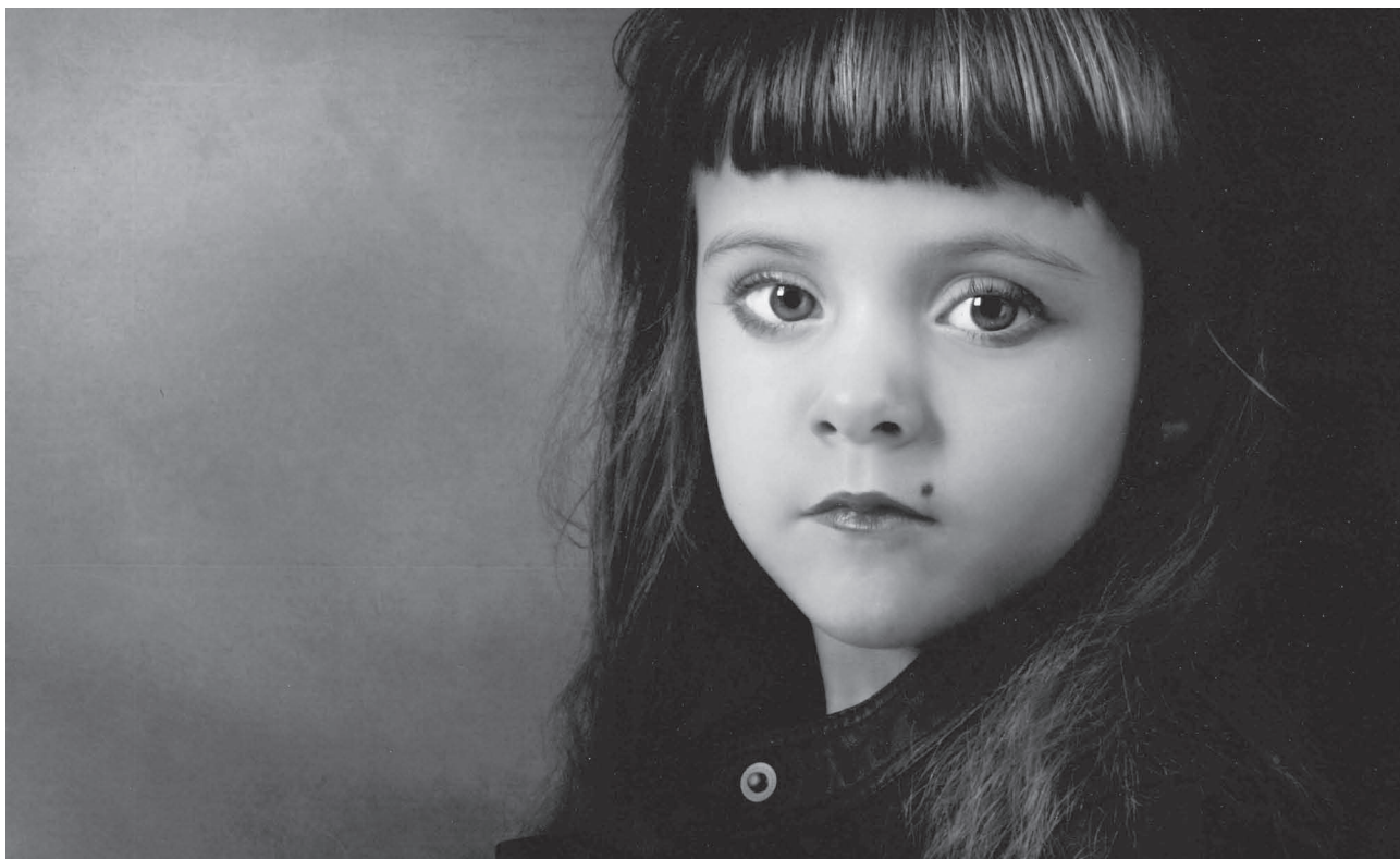
Concurs "Castell d'Or". Primer Premi Tema Lliure