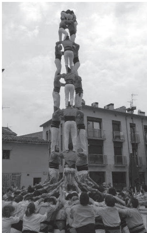
Jornada castellera dels Sagals d'Osona a la plaça Major

Ensenyament : (31-05-14) Felip Puig presideix l'acte de cloenda de curs al col·legi Pive.