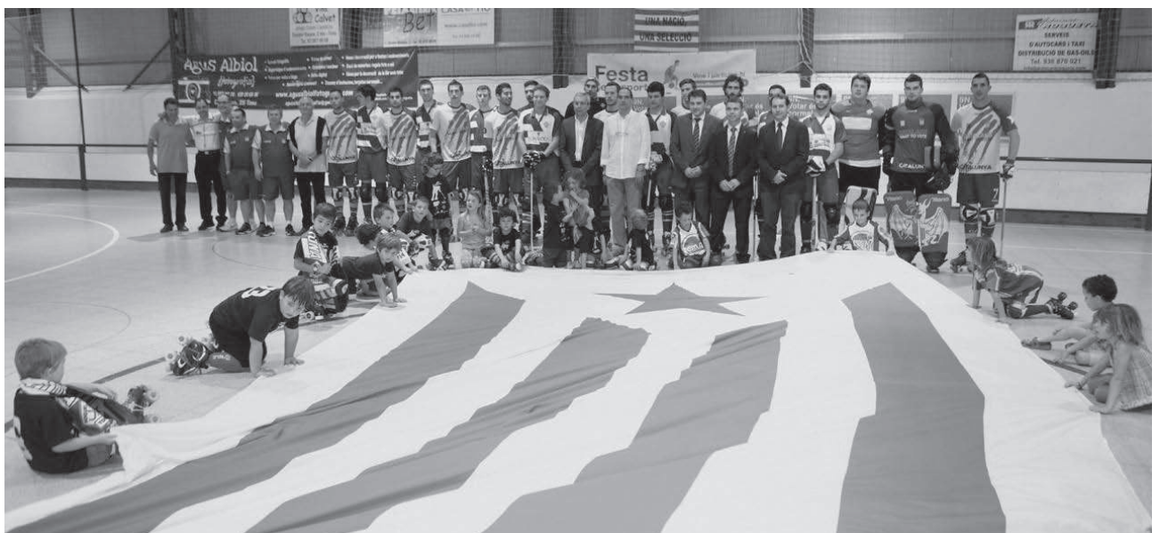
Els participants al partit entre l'HP Tona i la Selecció Catalana d'Hoquei al pavelló municipal d'esports

Cultura (23-06-14): Encesa de la flama del Canigó (plaça del monument a la sardana).