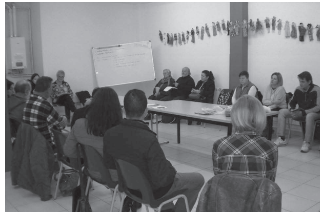
Assemblea de la PAH d'Osona al Casal Claret de Vic