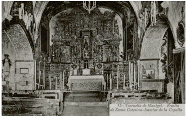
Capella de l'ermita de Santa Caterina

vila, estant constantment en ella 500 infants y 100 caballs vivint a descreció», per la qual cosa molts dels vilatans havien marxat «que si no haguessen sigut los guardas al portal y privat lo anarsen, no y fora restat ningú». Però gràcies a les súpliques fetes a la santa i que a més era el dia de santa Caterina, després de demanar-li la seva intercessió «y los francesos volent enderrocar las morallas minan aquestes posanhi polvora per ferlas bolar, no volgue la gloriosa Sta. se enderrocasen.» i les explosions feren molt poca destrucció i «se resolgue per lo consell pujar ab professó en dita Sta. Casa, y dar gracias a la divina Sta. de las marces rebudas de Deu nostre Sr. per son medi com de fet hi pujaren ab molta devoció tant comu, com particular».