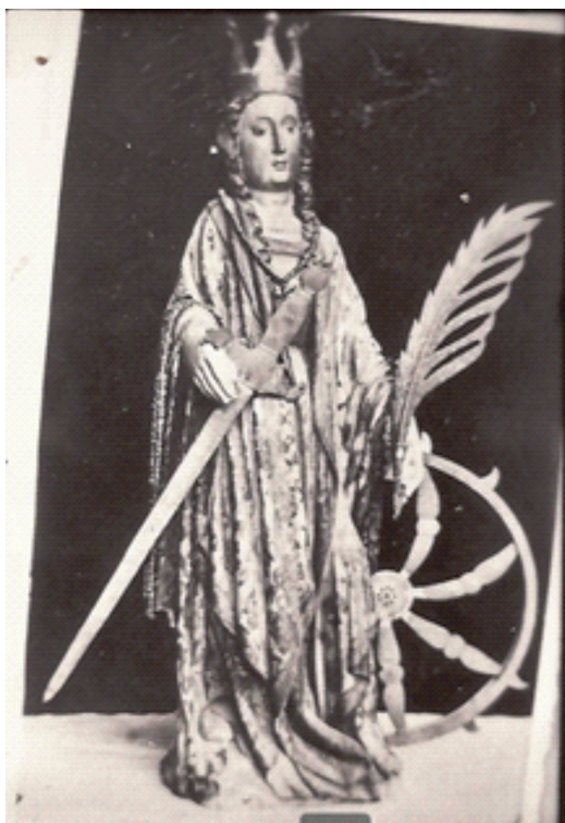
Imatge de santa Caterina que havia estat a la capella.