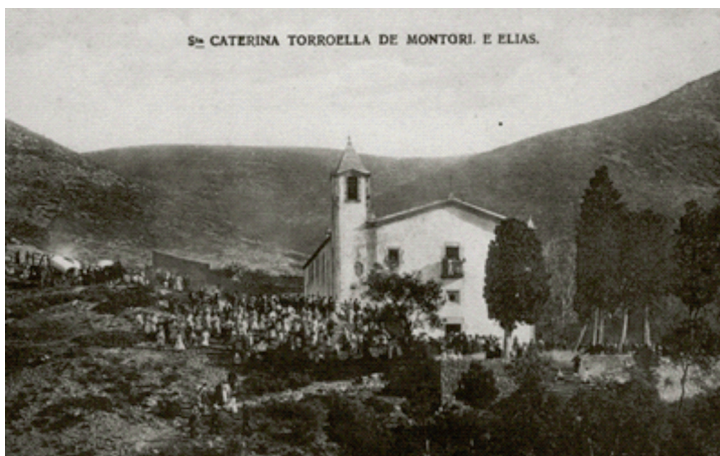
L'ermita de Santa Caterina