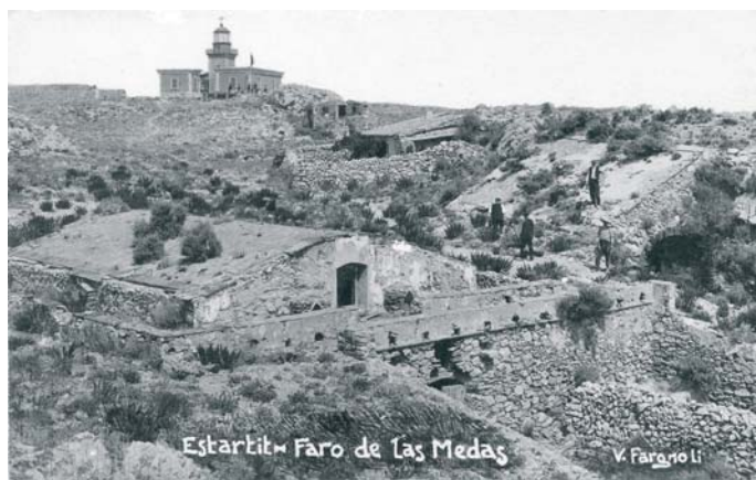
La Meda Gran. S'aprecien restes de construccions militars del període de la guerra del Francès i la cisterna d'aigua plujana per al subministrament a la guarnició.