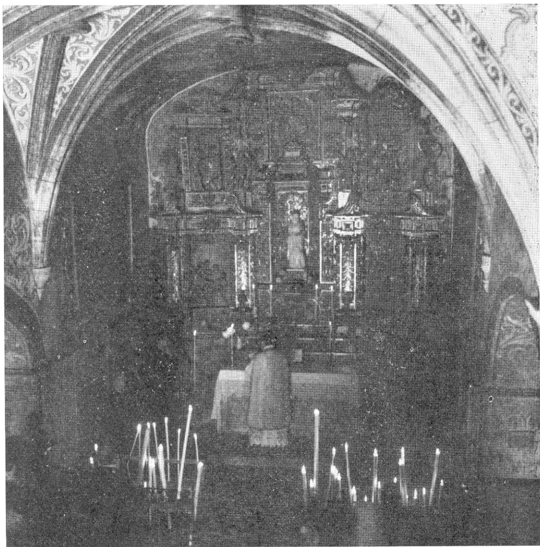
Missa en la capella de l'ermita de Santa Caterina en el Montgri.