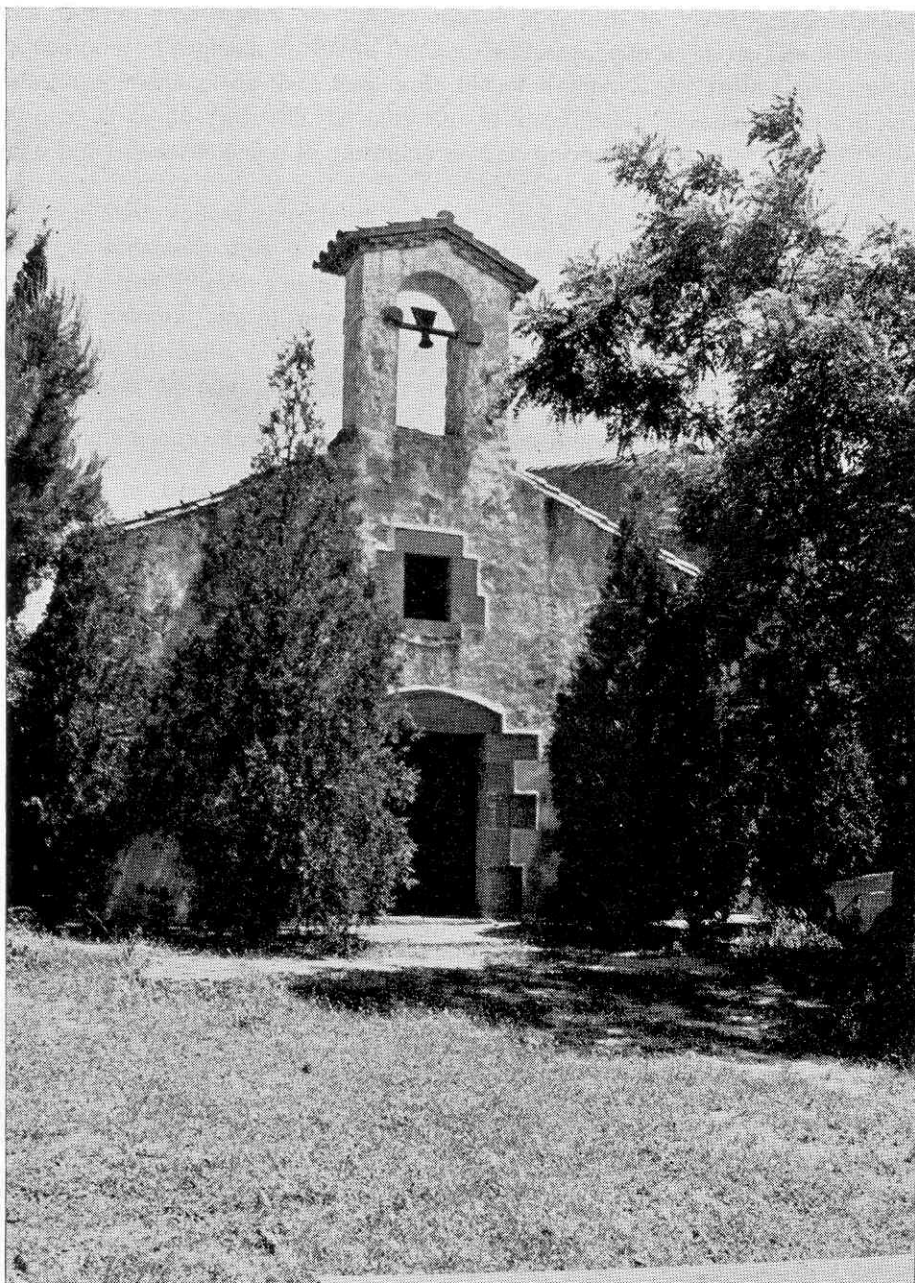
FAÇANA DE LA CAPELLA DE SANTA MARIA DEL MAR