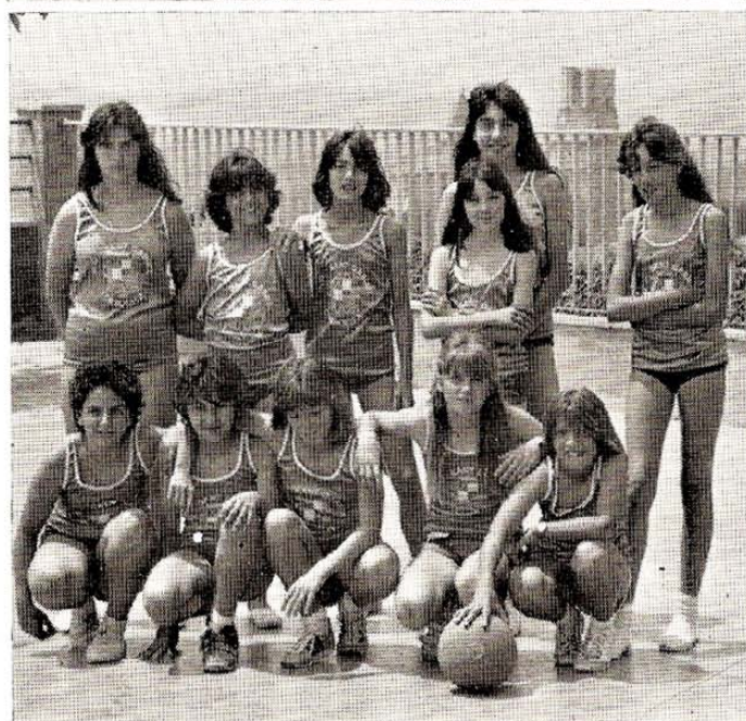
L'equip del Col·legi Guillem de Montgrí campió de Catalunya de gimnàstica i l'equip femení del Col·legi Sant Miquel campió «provincial» de mini-bàsquet els hem escollit com a representants de l'entusiasme i afició de la població escolar de Torroella vers la pràctica de l'esport.