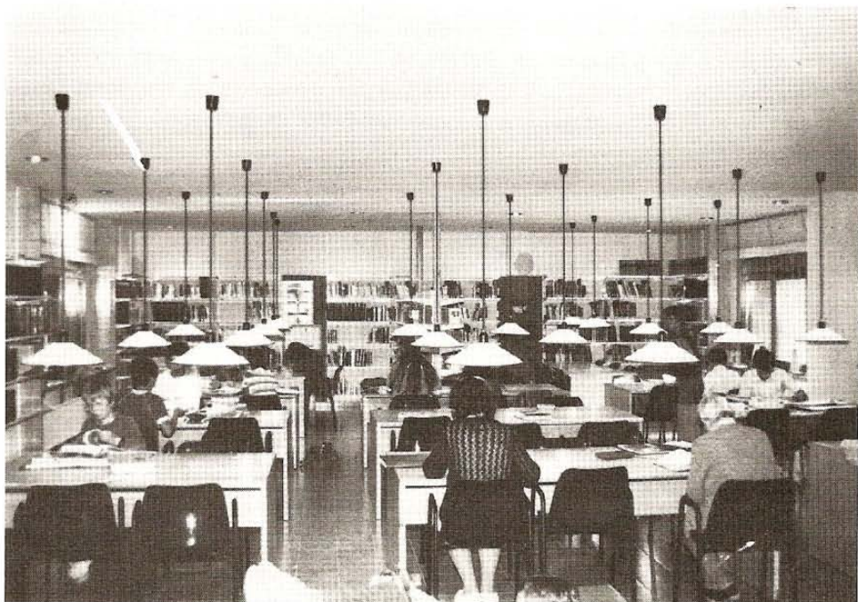
La nova biblioteca de «La Caixa» instal·lada al primer pis de la Casa de Cultura. A la planta baixa una moderna sala d'actes està acondicionada també per auditori i sala d'exposicions i projeccions.