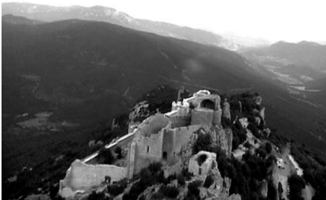
Castell de Peirepertuse