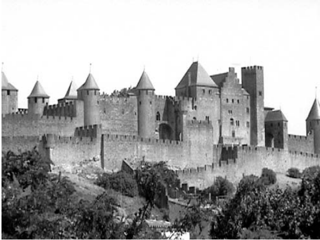
Carcassona. La Cité

"Deu és bondat infinita. Ell no pot ser el causant de tots els mals que passen al món. Això és obra del Maligne". Aquesta era la doctrina que predicaven els càtars, agafant el sermó de Crist a la muntanya com a norma de conducta: ajudar els pobres, els malalts, els desemparats i donar exemple de templança i castedat.