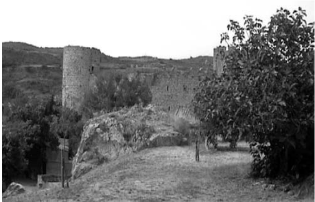
Castell de Vilarroja-Termenés

Tres dies després, el dia 24 d'octubre de 1321, Guillem de Belibaste fou cremat a la plaça del Castell. Les seves darreres paraules abans d'expirar foren: " D'aquí a set cents anys, el llorer tornarà a ser verd ".