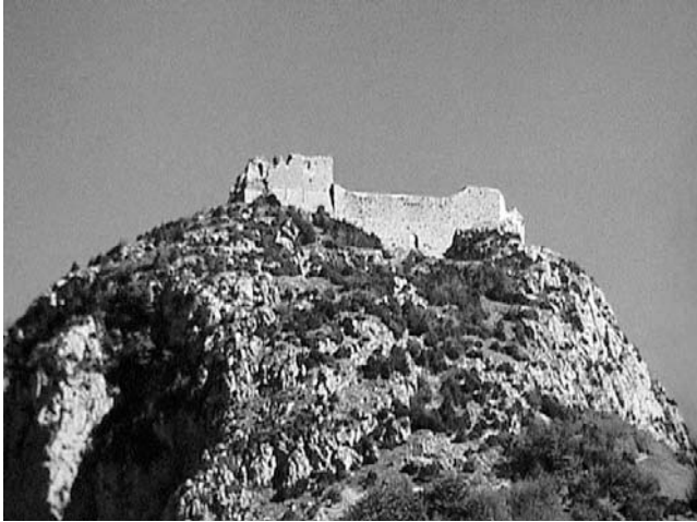
Castell de Montsegur