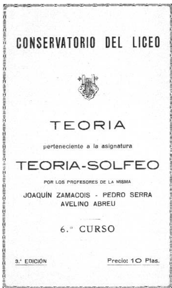
Mètode de solfeig d'Avel·lí Abreu

Josep Ponsetí i Torremilans. Fill de pare torroellenc i mare de Castelló d'Empúries. Des de 1854 fou el darrer mestre de capella a Torroella, població on morí l'any 1889.