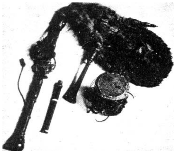
La cornamusa, el flabiol i el tamborí formaven part de les velles cobles (foto extra del Llibre de la Festa Major de 1962)

La cornamusa o sac de gemecs també és un instrument remot. Hi ha indicis a la Grècia antiga; i a Roma sembla que era tocada per Neró. A Catalunya, es va difondre en el mandat de Pere el Cerimoniós; quan Joan I tenia dos anys d’edat li posaren dos cornamusaires per distreure’l; poc després, li feren present d’una cornamusa, amb la qual practicava. L’instrument davallà paral·lelament al sorgiment de la cobla moderna, per bé que es conserva en algun indret.