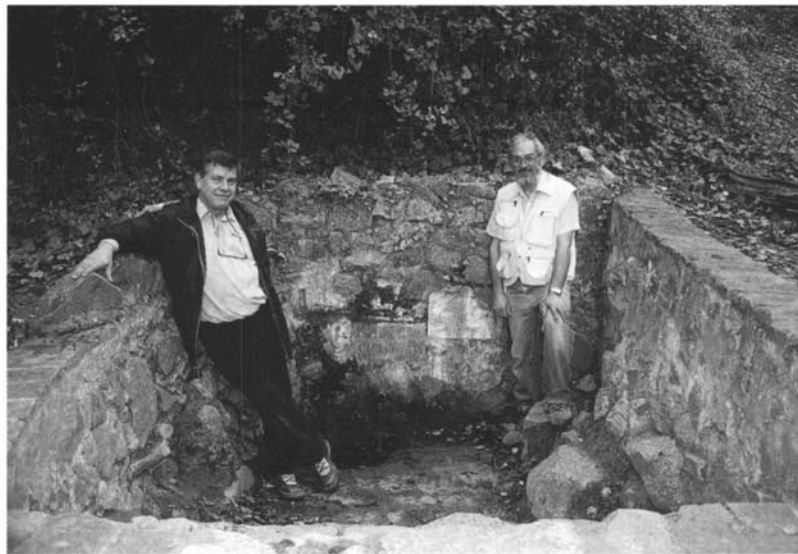
Els autors a la font d'en Gurri, Santa M. de Martorelles.