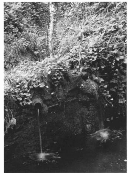
Font de Sant Joaquim, Vallromanes.

Es troba situada prop de la masia de can Gurgui Gros, que actualment és un restaurant en el qual es conserva un mural dedicat a la Verge del Carme i a sant Joan. A prop hi havia l'antiga església de Sant Andreu de Llavons que data del segle XI i un convent de monges. A la paret del restaurant que esmentàvem abans es conserva també un escrit que diu: Notes històriques de Vallromanes per Rosa Mogas, 1927 (text original), «Sobre la casa de Sant Andreu de Llavons, avui Gurgui, a la part de migdia del camí que va de dita casa nova de Bru ate Cuillamí en lo bosc i a la part de vessant de la font de dita Casa Gurgui se observan senyals de ruines com de una casa o edifici i les aigües fluviales a menut descobren varios ossos de persones. Lo que