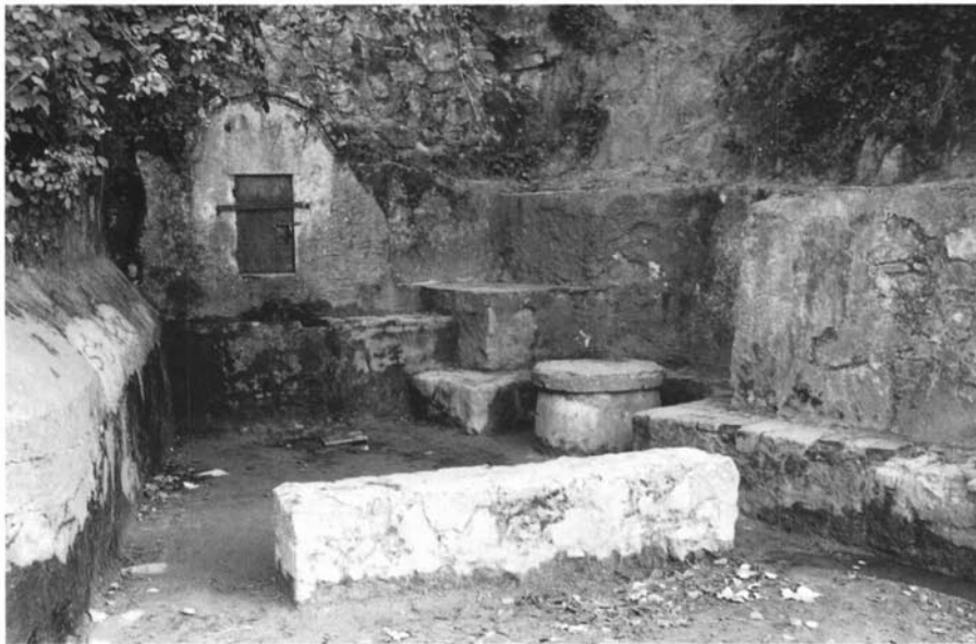
Font d'en Gurgui, Vallromanes.