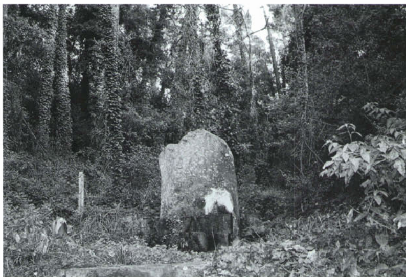
Font Better, Sant Fost de Campsentelles.

Se situa a les muntanyes de la Conreria. Des d'aquest indret podem gaudir d'unes bones vistes del Vallès. Actualment, al costat hi ha un restaurant que porta el mateix nom i continua sent un lloc d'esbarjo per a moltes famílies dels environs. Els anys cinquanta i seixanta l'aigua de la font va ser comercialitzada per una empresa de Badalona a causa de les propietats medicinals que se li atribuïen, però amb la generalització dels automòbils particulars la gent va poder arribar a la font amb els seus propis mitjans i s'interrompé la seva comercialització (RIFÀ, 1987: 86).