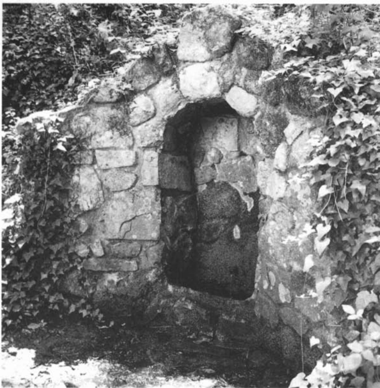
Font de la Mansa, la Roca del Vallès.