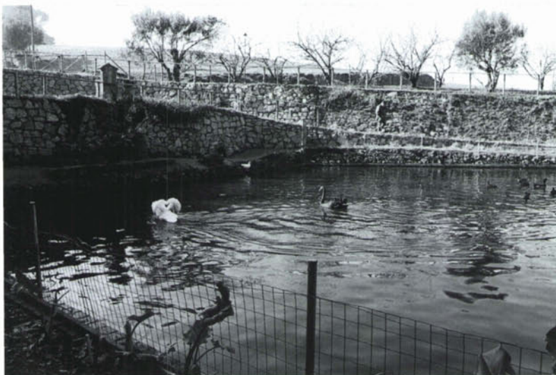
Font de can Sala, Montornès del Vallès.

i del Mogent. Són les que dissenyem a continuació: font de can Torrents (30), el Safareig de les Bruixes (31), font de can Prat (32), font de can Sala (33), font de can Saüquet (34), font de la Plaça (35), font de can Fornes (36), font de can Parera (37), font de Santa Caterina (38), font de can Xacó (39), font de can Masferrer (40) i font de Sant Miquel (41).