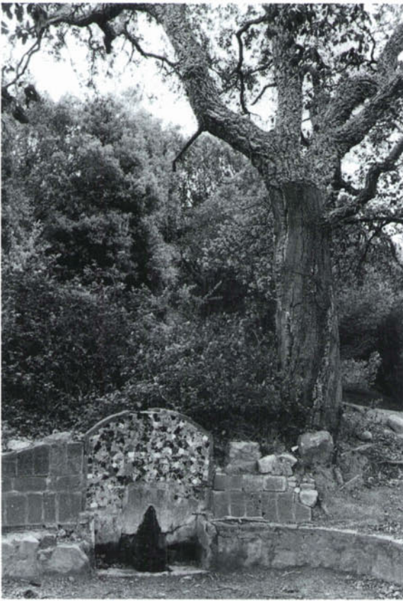
Font de Sant Jaume, Vilanova del Vallès.