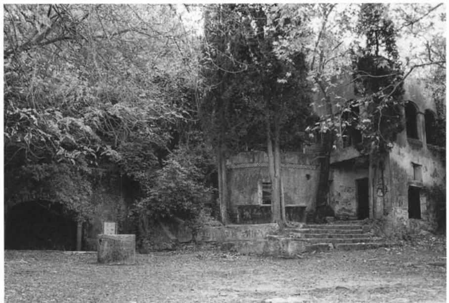
Font de les Monges, Sant Fost de Campsentelles.

No gaire lluny de l'antic seminari de la Conreria trobem aquesta font plena d'història però avui molt abandonada. Sembla ser que el nom li ve donat perquè era molt freqüentada per les monges del convent de Montalegre, 3 a Tiana, les quals anaven a passejar per aquests rodals (RIFÀ, 1987: 74). Hi ha uns quants edificis al voltant de la font, un dels quals, un antic restaurant. A principis de segle hi havia, al costat de la font, una imatge de sant Bru, patró de l'ordre dels frares de la cartoixa de Montalegre, que va desaparèixer durant la Guerra Civil. També s'hi han anat celebrant aplecs de sardanes i trobades, però actualment ja no se n'hi fan (RIFÀ, 1987: 74-75). Com a fet curiós, volem destacar que en aquesta font foren preses nou persones durant la darrera guer-