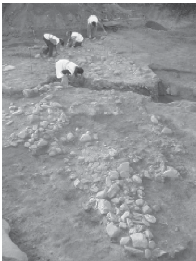
Feines de neteja i documentació del camí pavimentat.

Així tenim un primer sistema de canalitzacions bastant simple, consistent en dues rases de grans dimensions, sobre el qual se superposa un segon sistema de més complexitat, que prenia aigua de punts diversos amb l'objectiu de concentrar-la en un únic rec principal, mitjançant dos recs de grans dimensions, un dels quals venia del torrent mentre que l'altre provenia de l'angle septentrional del jaciment; tots dos conflüen en una mena de resclosa