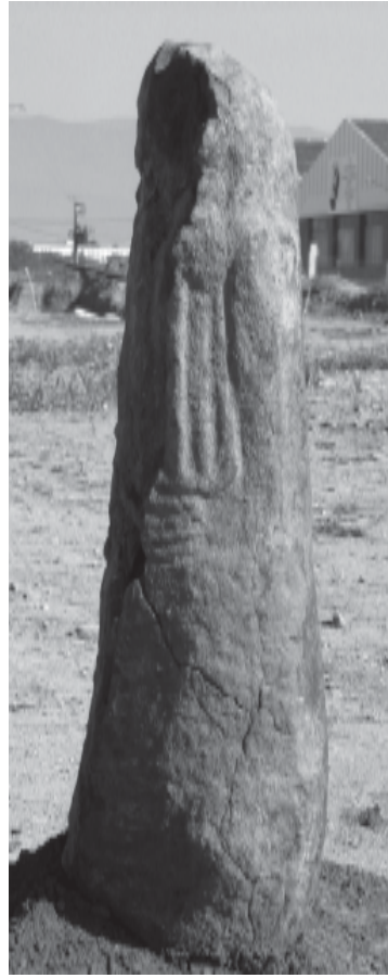
Vistes de les cares lateral i posterior de l'estàtua menhir antropomorfa de Ca l'Estrada.

forma similar a les figures del grup Rouergat (Serres, 1997; Philippon, 2002). La peça de Ca l'Estrada, però, està trencada en aquest punt i no podem assegurar aquesta interpretació.