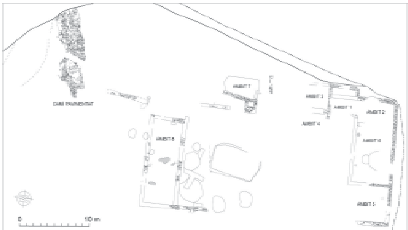
Planta general de les estructures d'hàbitat i el camí pavimentat d'època republicana. (Dibuix: autors)

Les restes que s'adscriuen al moment baixrepublicà es concentren, fonamentalment, a l'àrea nord-oest del jaciment. Si ens centrem primerament en la fase IIIa, tenim dues sitges amb unes dimensions d'uns 65 cm de diàmetre i una fondària de 130 cm, que en cap cas no van donar gaire material, i en les quals destaquen les restes d'un gos dipositat al fons d'una. També hi havia un conjunt de deu fosses, cinc de les quals eren de tendència circular, de 140 i 210 cm de diàmetre per un màxim de 45 cm de fondària. Respecte a les altres cinc es tractava de petits retalls ovalats, amb uns eixos d'entre 40 i 60 cm per 25-30 cm i una potència d'entre 10 i 20 cm. Tant les unes com les altres podrien estar relacionades amb algun procés artesà o, fins i tot, amb les feines de construcció de l'edifici de la fase següent.