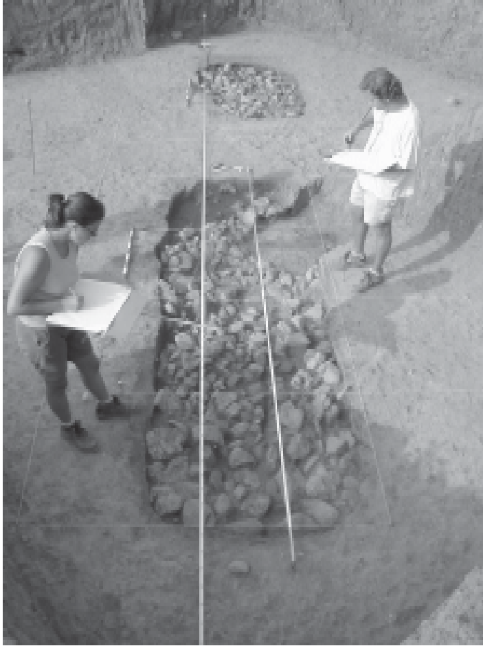
Feines de dibuix i documentació de les estructures de combustió EC-409 i EC-410.

però posteriors troballes, com ara nombroses restes de macrofauna en una fossa al costat d'estructures similars en el jaciment de Villeneuve-Tolosane, van reforçar la idea que poguessin ser grans graelles on es rostia carn a mode de grans àpats cerimonials (Vaquer, 1990; Vaquer et al. , 2000). Actualment encara en podem trobar paral·lels etnogràfics en els focs polinesis.