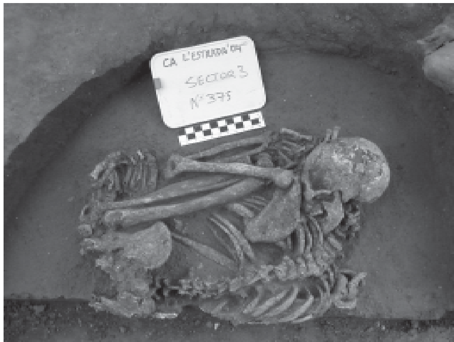
Vista general de la inhumació de l'individu adult (SF-501).

En l'extrem sud del jaciment van aparèixer dues inhumacions: un individu adult i un infant. L'individu adult estava inhumat en posició fetal, es trobava molt replegat i tenia com a únic aixovar una làmina de sílex blanc de 10 cm situada al costat de la pelvis. L'estudi antropològic 1 suggereix que per la posició del cos, probablement l'individu fou inhumat en un forat molt petit recolzant-lo contra les parets de la mateixa