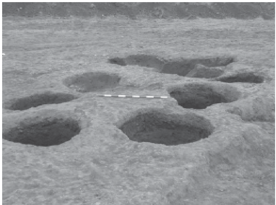
Vista general de l'agrupació de sitges medievals del sector 5. (Fotografia: autors)

La resta de materials exhumats indica l'existència de diferents activitats domèstiques properes, tals com la cuina i el tractament d'aliments, o de caràcter artesà, com seria la forja. La presència de restes òssies d'animals pot indicar un tipus d'explotació agropecuària,