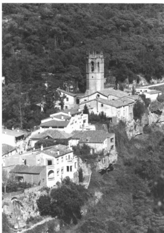
Nucli històric de Sant Quirze Safaja.

Totes les fases de fabricació d'aquests materials: preparació de la terra, modelatge, dessecació, cocció i emmagatzematge tenien uns espais i unes formes de treball específiques que l'Ecomuseu del Moianès recuperarà a partir de l'espai radial de Sant Quirze Safaja.