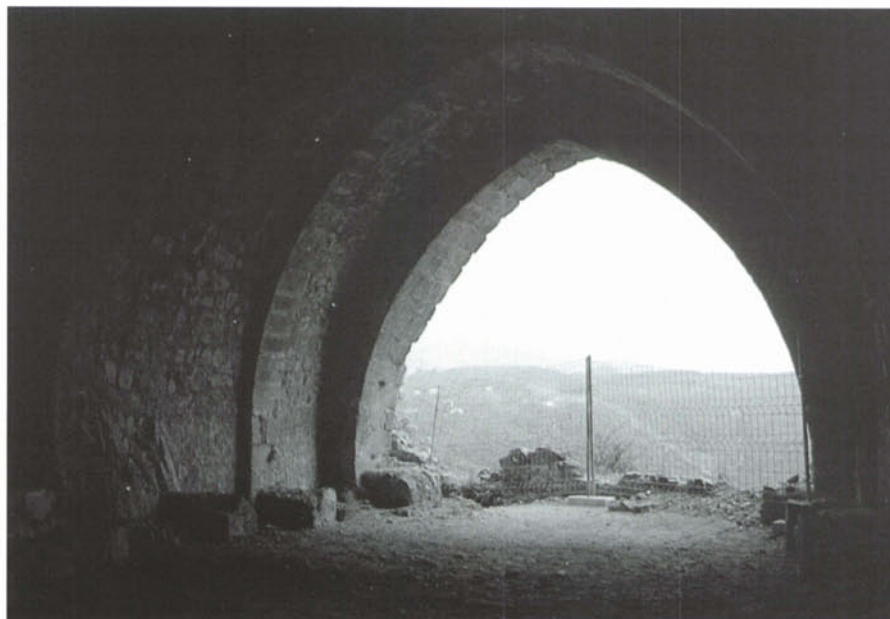
Sala gòtica.

Aquesta potent estructura arquitectònica suportada per murs d'un metre d'amplada, permetia disposar, a la seva part superior, d'un ampli andador, amb paviment de signinum , que esdevenia, al mateix temps, un punt clau del pas de ronda, un extraordinari punt fort sobre el fossat (quinze metres per sota) i el recinte annex, culminat a tramuntana per la torre de les Bruixes.