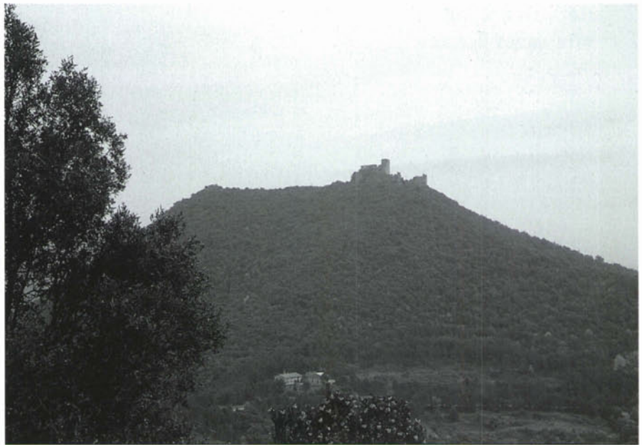
El turó de Montsoriu amb el castell al seu cim. (Fotografia: MEMGA).

És interessant ressenyar que l'esment del comte d'Empúries, Ponç Hug, com a propietari del castell de Montsoriu ve donat pel seu matrimoni amb Marquesa, vescomtessa de Cabrera.