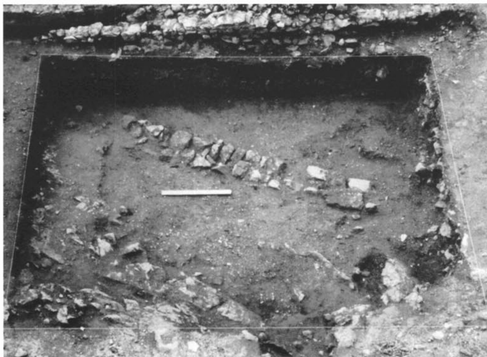
Restes de les estructures del segle XIII en el pati d'armes. (Fotografia: MEMGA).

Pel material recuperat en aquests nivells, la ceràmica és de difícil adscripció, ja que es tracta, bàsicament, de ceràmiques grises;