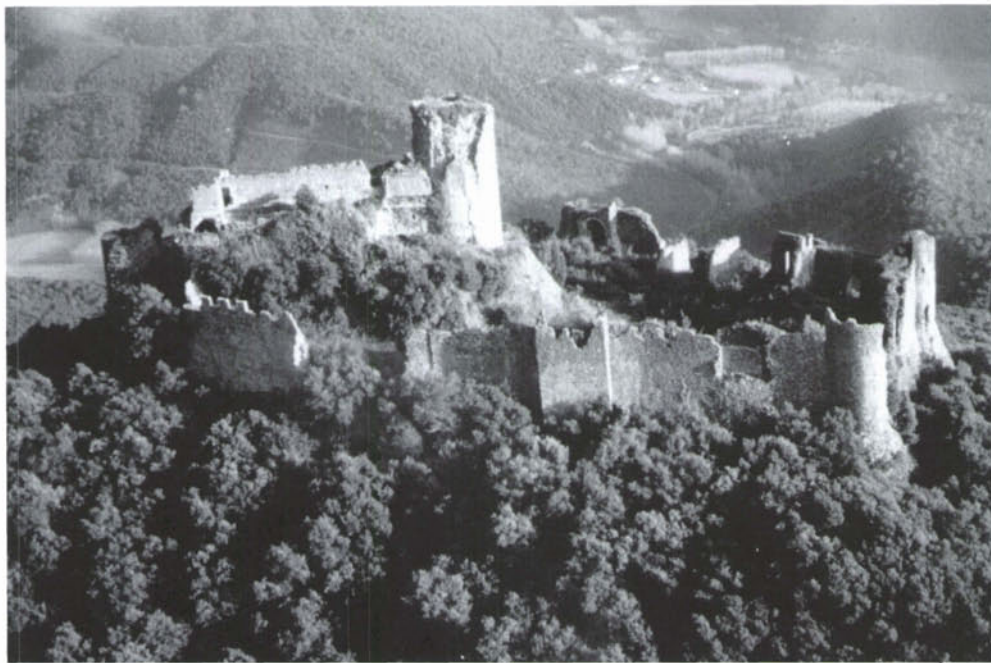
Montsoriu abans que s'iniciessin les tasques de restauració.

llarg de més de quatre segles i vinculat directament als avatars d'una de les nissagues més preeminentes de la història medieval catalana: els vescomtes de Cabrera.