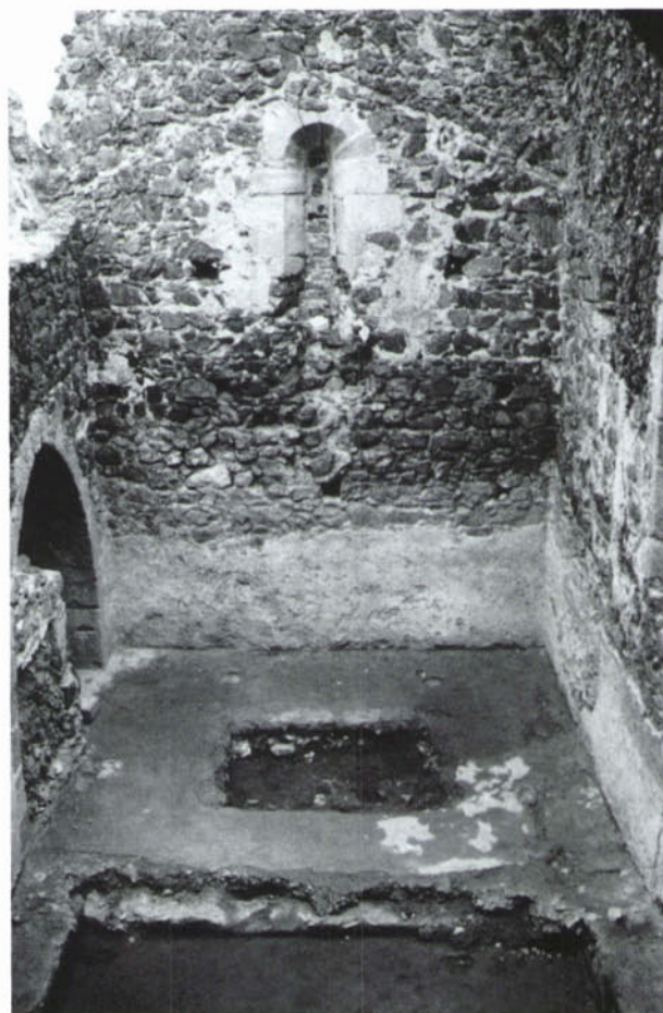
Capçalera de la capella romànica. (Fotografia: MEMGA)

capella de Montsoriu (en documents de 1268, 1269 i 1274).