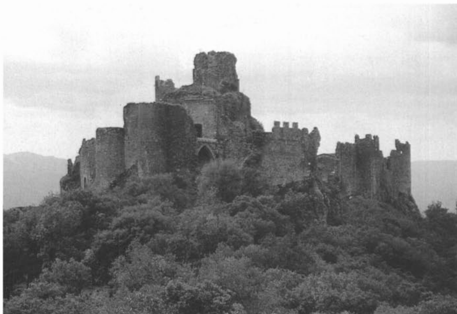
Vista del castell des de la torre de les Bruixes. (Fotografia: MEMGA).