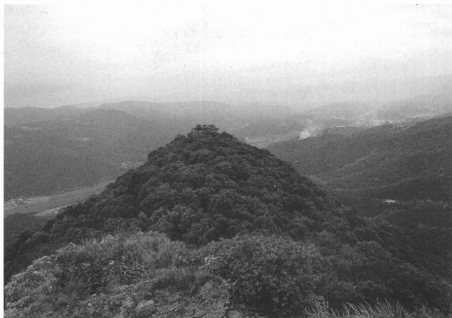
Vista de la torre de les Bruixes des del castell.

D'altra banda, la seva simplicitat estratigràfica ens demostraria que aquest recinte només fou emprat durant un període relativament breu entre el segle XIII i principis del XIV, i que no hi va haver ocupacions posteriors d'importància.