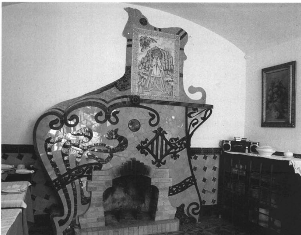
La llar de foc del menjador de can Millet.

de la panxa de la llar de foc. Aquest cercle vermell, segons expliquen els hereus Millet, simbolitzava el cor de la família, ja que es reunia al seu voltant, vora del foc.