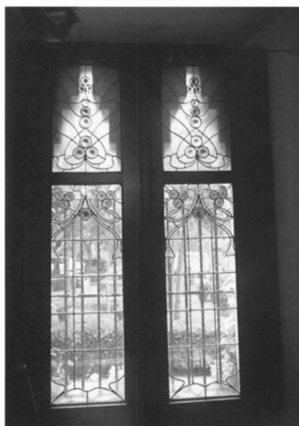
Detalls dels vitralls de les finestres de la planta baixa i el primer pis de la casa Millet.

De la decoració d'interiors, en Raspall, són, bàsicament, les llars de foc els elements més destacats. I, en especial, dues, la de la Casa Barbey de la Garriga i aquesta de can Millet, ambdues, clars exponents de l'estètica modernista. La llar de foc de can Millet destaca per la seva forma sinuosa i asimètrica, que crea un volum més ampli a la part baixa i es va degradant fins a sumar-se al mur final en la part alta. És coberta de ceràmica groga aplicada en trencadís que sembla dibuixar la forma d'un drac mític, amb la presència d'un suposat ull vermell a la part superior de la xemeneia. Encara, a més, incorpora altres elements ornamentals com a resum de la utilització de les arts aplicades: un escut romboïdal amb quatre barres, que enllaça amb les esses a cop de fuet de la forja que abracen la panxa de la xemeneia; quatre barres sinuoses de vermell i un punt vidrat en vermell intens al centre