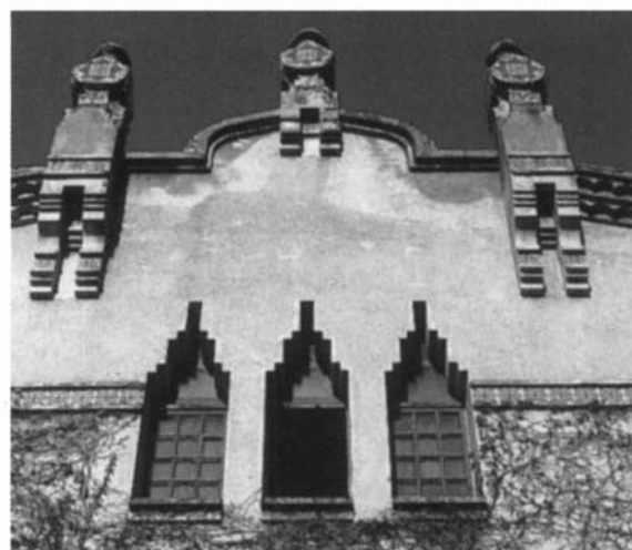
Detalls de la torre i el capcer de can Millet.

Una altra de les noves construccions de Raspall és el cos afegit al costat de ponent de la casa. Aquests cos, de planta baixa amb coberta plana de terrat, estava destinat a magatzem i garatge. El terrat està tancat amb una treballada barana de totxo vist i els buits de la façana són d'arc carpanell tripartits. Resulta, avui, un assaig per a futures solucions semblants, que trobarem l'any 1909 al magatzem de Salvador Clavell a Cardedeu.