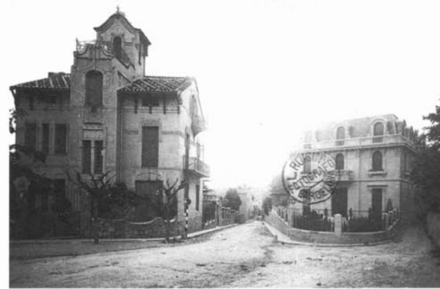
Al costat esquerre es veu la cantonada nord-est de la Torre Iris (1911).

La sisena «mansana» és la delimitada pels carrers de l'Ametlla, de la Ronda del Carril, de Rosselló i del Guinardó. Està ocupada per una sola propietat, anomenada La Caritat . Aquest edifici va ser construït l'any 1913 per la Junta de Caritat de l'Asil Hospital i sortejat posteriorment per tal d'obtenir beneficis per a la cons-