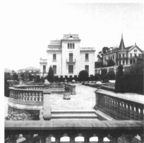
Façana sud i jardí de la casa anomenada La Caritat, a la sisena «mansana Raspall», edificada l'any 1916. En primer terme veiem les balustrades i l'escala del jardí. En segon terme, al costat dret, es veu la casa de Josep Suñol, bastida l'any 1906 segons projecte de l'arquitecte Emili Sala i Cortés.

D'aquesta lectura es dedueix que s'ha de protegir el que resta del conjunt de les sis «mansanes Raspall» i que s'ha de controlar tota intervenció en el conjunt, ja que són edificis o conjunts molt representatius d'un moment àlgid de la història urbana de la Garriga.