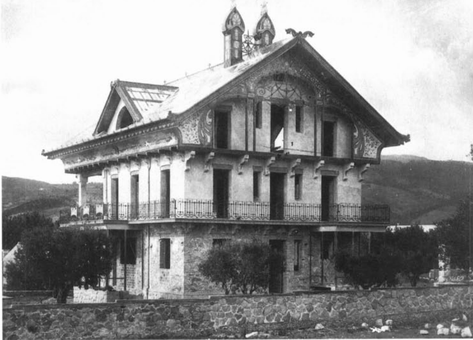
Cantonada sud-est de la casa del Parc Serra, edificada l'any 1909; inacabada i transformada en la dècada dels anys 40.

tada pels carrers del Figueral, el Passeig, de Caselles i de Manuel Raspall, i la constitueixen quatre edificis singulars bastits en el quadrienni de 1910-1913. Es tracta d'un conjunt únic en la història de l'arquitectura modernista catalana, ja que consta de quatre edificis aïllats, situats a la mateixa «mansana» i bastits en un període curt de temps (1910-1913), i són molt representatius del llenguatge modernista de la primera etapa en què es pot dividir l'obra de Raspall. Per la seva situació, el conjunt constitueix una fita arquitectònica important dins el paisatge urbà. Està situada estratègicament a l'entrada del llarg passeig de plàtans, on també hi ha la segona i la tercera «mansana Raspall».