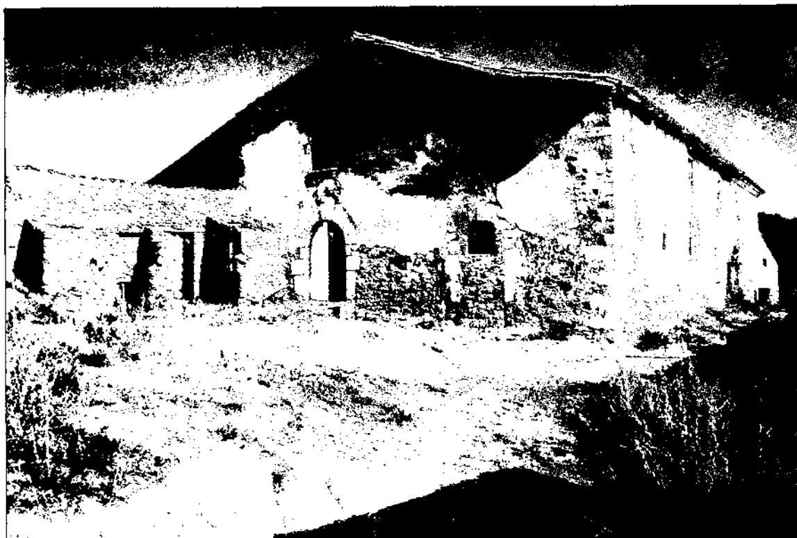
Can Terrades (La Ballarà), Sant Celoni.

UNES NOTÍCIES DE LA SOCIETAT VALLESANA MEDIEVAL