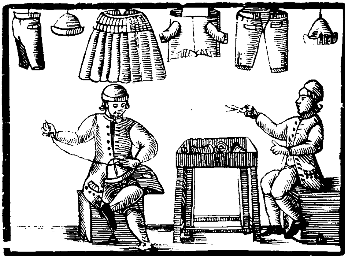
Gravat al boix: Sastres treballant. AMADES, J. Apunts d'imatgeria popular. Barcelona 1983

madament, eren matrimonis. De fet devia ser una exigència jurídica que la dona, qui a través de la garantia dotal posseïa drets sobre els béns familiars i assumia responsabilitats en la marxa de l'empresa familiar, figurés al costat del marit en els actes jurídics de transacció de béns més importants. Mort el marit i essent els fills menors d'edat, la dona podia durant un temps exercir les funcions de cap de família.