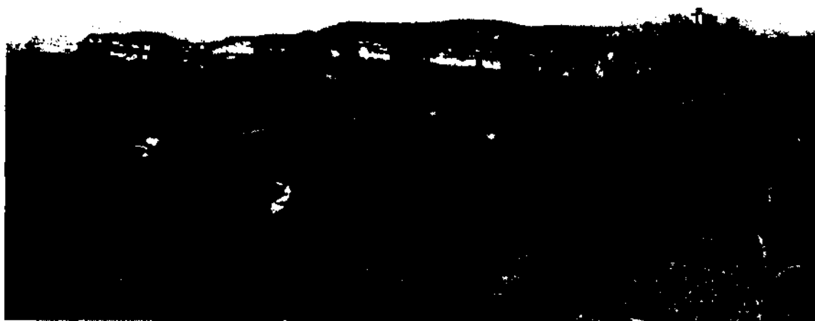
El Togonament, els cingles del Berri i Collrfo, sant Llorenç del Munt i Montserrat, des de la Colma.

—el Parc del Montseny, el Parc del Corredor-Montnegre, la Serra de Marina, la rehabilitació de l'espai natural de Sant Miquel del Fai, etc...— i una nova embranzida en la construcció de places hoteleres. Amb la construcció d'un hotel a Mollet del Vallès —Hotel Climat, inaugurat el mes d'abril de 1991—, un a Vilanova de la Roca —Alfa Vallès, inaugurat el 1992—, un altre a la Torreta, entre Granollers i la Roca del vallès —l'hotel Ciutat de Granollers— i un altre a Granollers, a la carretera del Masnou, aquest darrer en construcció, l'oferta s'ampliarà enormement. D'unes 1.574 places hoteleres l'any 1991, es passarà a finals de 1992, a un total de 2.200 entre hotels, balnearis i hostals. No hi ha cap dubte que tant la industrialització pròpia de la zona com el rendiment que es preveu que pugui tenir tot aquest conjunt d'actuacions comportarà un augment considerable, més encara, de la població flotant.