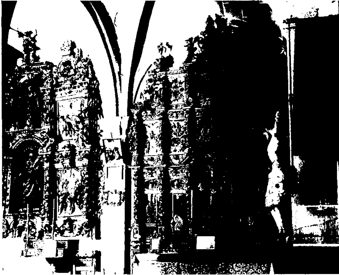
Interior de l'església. Capelles del Roser (en primer terme) i de Sant Isidor i Sant Isidre, amb els altres barrocs cremats el 1936.

familiars) i donava a la parròquia un valor de 60 lliures, amb unes càrregues de 111 sous i 4 diners [8] . Igualment, sembla que durant aquest mateix segle l'església no va ser modificada. Les reformes arribarien pocs anys més tard.