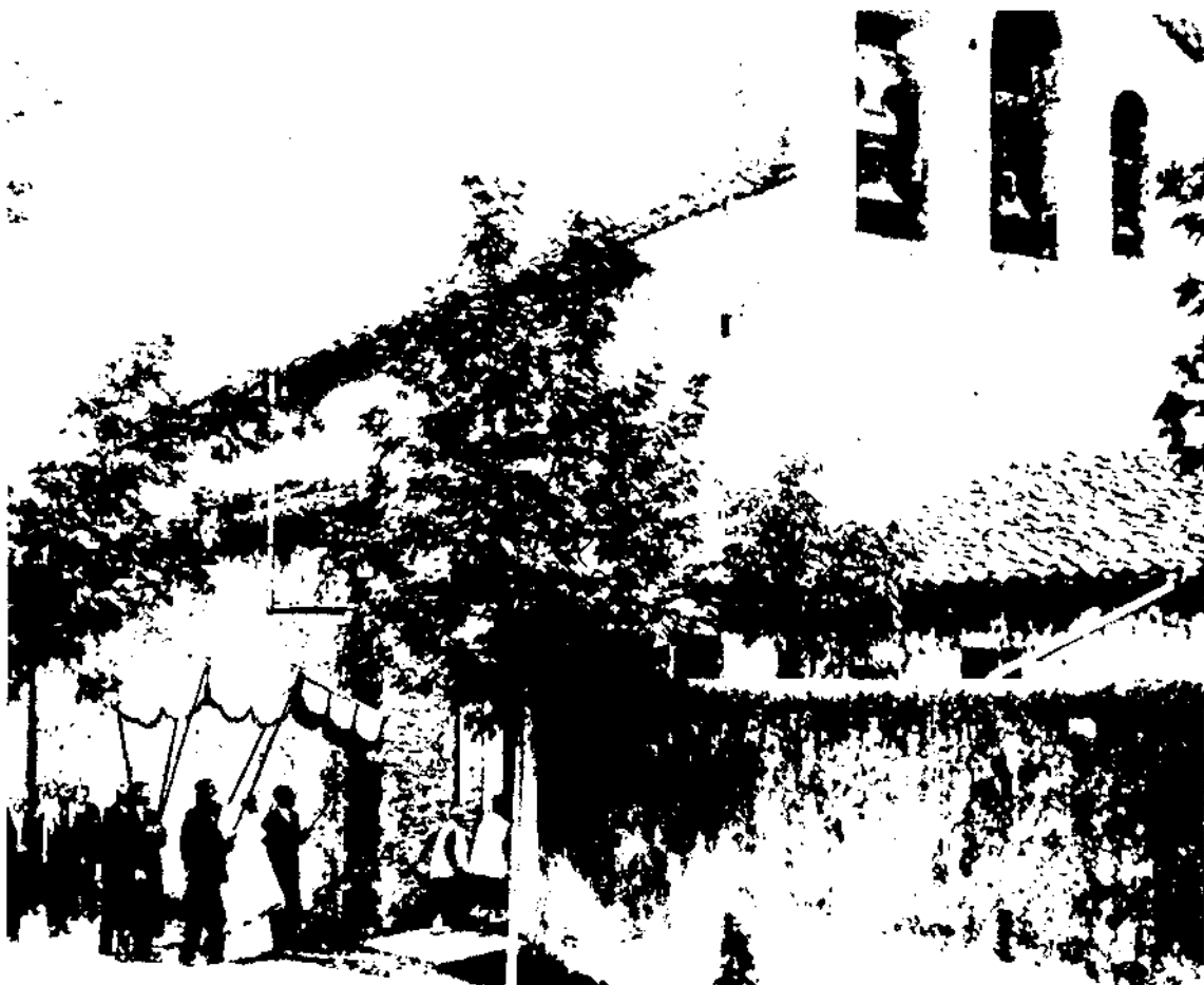
L'església vista des de l'angle nord-oest, l'any 1931. L'edifici adossat a la façana és la rectoria.

Per tant, es pot pensar que la construcció d'ambdós temples devia realitzar-se dins el mateix període.