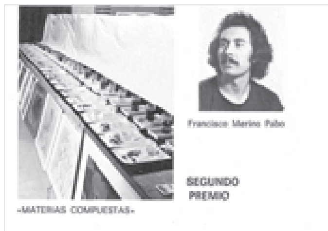
Programa del III Concurso de Arte Joven Ciudad de Granollers, 1974.

mateix utilitza per definir la seva pintura en una entrevista que li fa Frederic Nadal a la revista Vallès l'any 1975.