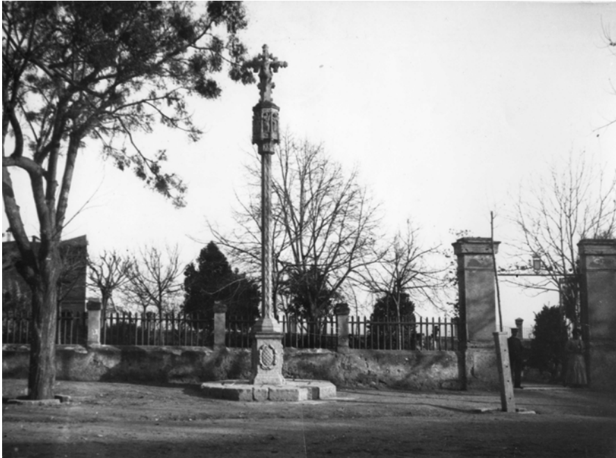
Creu de terme al passeig de Sant Antoni (voltants 1900). Autor desconegut. CIT / L'Arxiu. Sig. Top. 46608

L'any 1936, en esclatar la guerra, es va decidir desmuntar la creu i guardar-la. Una part es deixà a la porta ciclòpia de la muralla del passeig, i la resta va fer cap a unes dependències municipals de la baixada del Roser. Posteriorment es traslladà al claustre de la catedral, on fou restaurada. L'any 1940 es va tornar a posar la creu al seu lloc habitual.