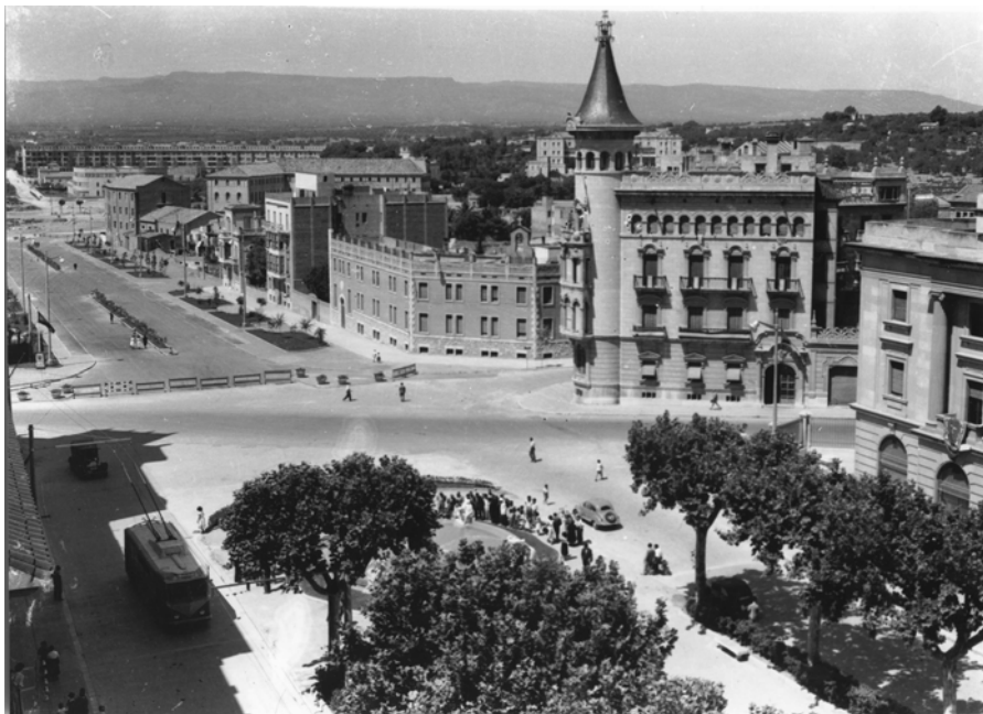
Imatge del tram de la Rambla Nova que va de la font del Centenari fins la plaça Imperial Tarraco. A la dreta, la «Casa de la Punxa», seu actual de la Cambra de Comerç de Tarragona. Autor: Chinchilla, 1954. CIT / L'Arxiu. Sig. Top. 48829

La planta de l'edifici és trapezoidal i irregular; disposa de semisoterrani, planta baixa, tres pisos i té una torre circular semi-exempta, que remata el dibuix de la construcció. La planta baixa està feta amb encoixinat. El portal d'accés és de punt rodó; simula unes dovelles col·locades a salta cavall. La planta baixa té unes finestres rematades amb un frontó triangular.