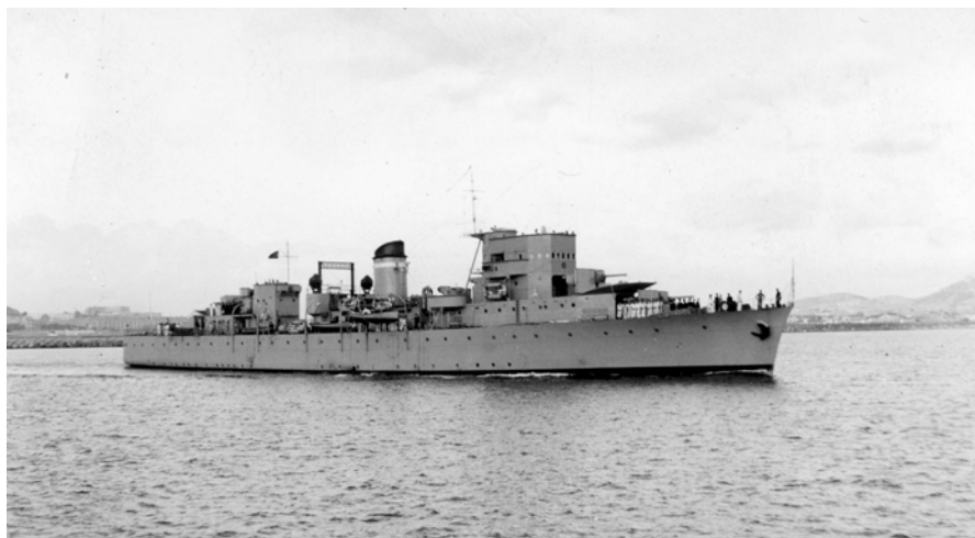
Vista del dragamines Vulcano (24/04/1955). Autor: Casau. CIT / L'Arxiu. Sig. Top. 45055

Donat de baixa el 30 d'abril de 1977, fou l'últim vaixell que es donà de baixa dels que havien participat en la Guerra Civil.