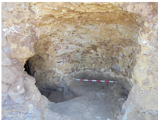
Vistes de la galeria excavada a la roca utilitzada com a probable refugi. (Autor M. Toda. A Priori Cultural).