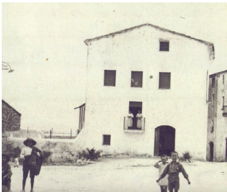
Fig. 3 Antiga Rectoria i mur del cementiri vell. Inicis del segle XX.