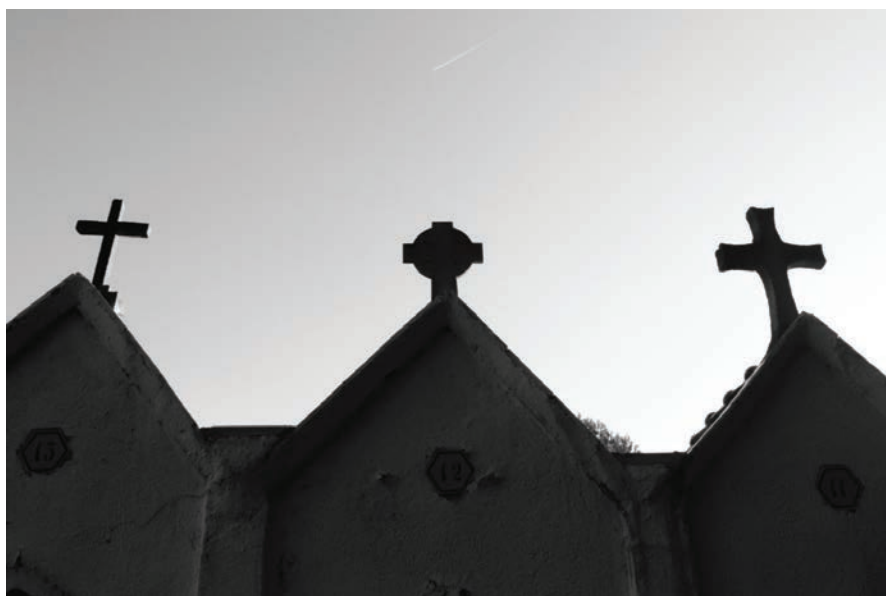
Fig. 6 Nínxols del cementiri nou.