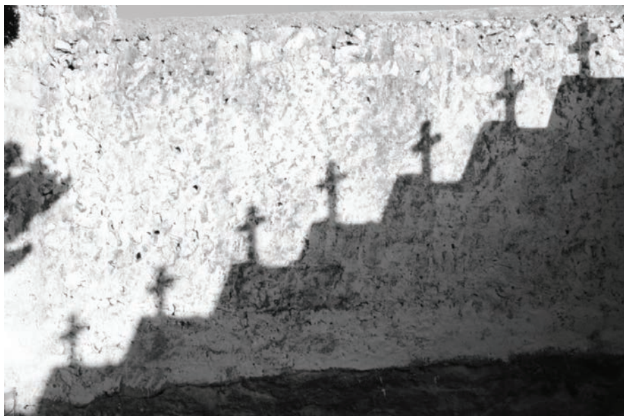
Fig. 5 Ombra dels nínxols del cementiri nou, l'escala cap a Déu.