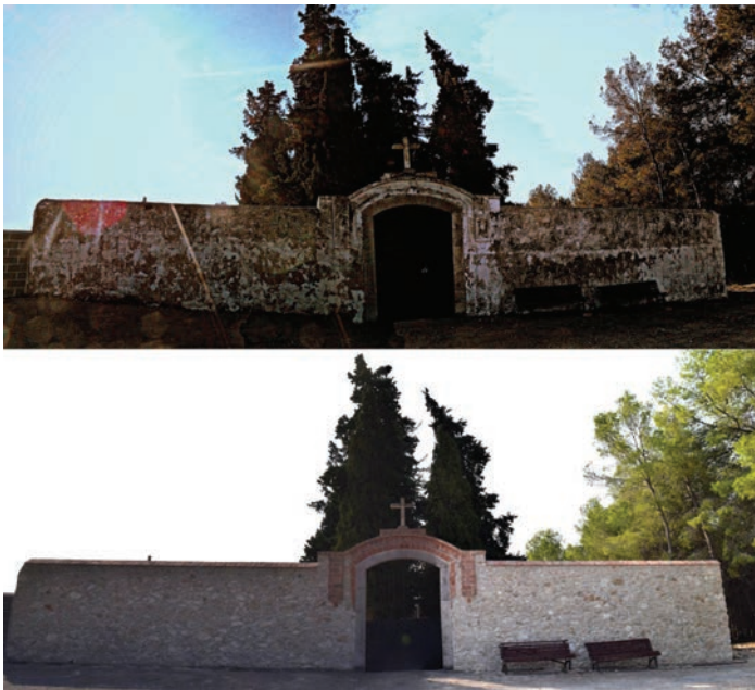
Fig. 4 Cementiri Nou de l'Argilaga, abans i després de la restauració de la façana de l'any 2017.

Actualment hi ha quatre panteons. En un d'ells hi ha una creu monumental amb una corona de llorer. Moltes de les làpides dels nínxols segueixen resistint-se a la modernització i les ànimes finides hi descansen tapiades amb una làpida de totxanes i calç, amb les inicials del nom i dels cognoms incises sobre la calç fresca.