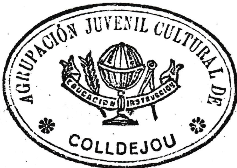
Segell de l'Agrupación Juvenil Cultural y Laica de Colldejou de 1932.

Aquesta acció milloradora pot ser formal, deliberada; pot ser deliberada, però no integrada al sistema escolar, i pot ser no deliberada, però d'ampli abast.