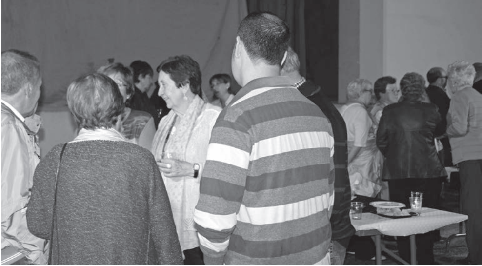
Aperitiu de cloenda de la XLIV Jornada de Treball del Grup de Recerques de les Terres de Ponent.