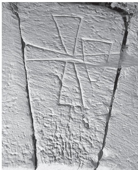
Gravat del castell templer de Vallfogona de Riucorb (Lleida).