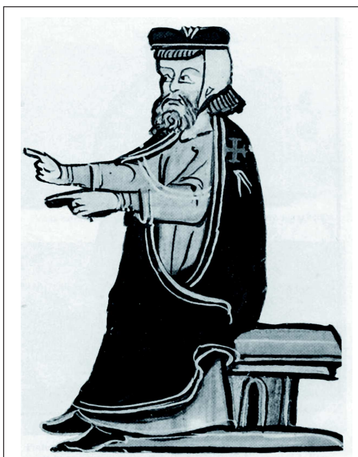
Detalls. Miniatura del templer Jaume d'Ollers. Templers en un sepulcre de Villasirga (Palència)