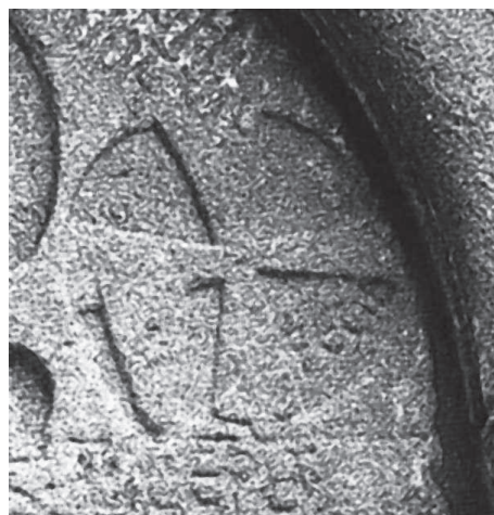
Detall del timpa de l'església del Temple de Taboada dos freires (Lugo).

Cirlot proposa que el simbolisme del triangle escantellat amb el vèrtex mirant cap a baix (triangle púbic) ja s'associava en contextos prehistòrics amb la fertilitat i la Mare Terra 46 . En conseqüència, si la creu antigament era un símbol solar que posteriorment va representar al Crist, el cinquè triangle sobreposat damunt la creu podria correspondre a la representació simbòlica de la Terra, i per associació de conceptes, a la Verge Maria. Un nou exemple de superposició d'un símbol sobre un altre.