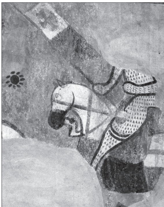
Portador del Gonfanó, mural de l'eglésia del Temple de Bevignate, Itàlia.

La insígnia de guerra de l'orde del Temple era el «Gonfanon baussant», també conegut a Catalunya com a «balçà», el qual era partit en dos colors: blanc en el quadrant superior i negre en el quadrant inferior 21 . La part superior de l'estendard, de color blanc, duia en el seu centre la representació d'una creu patada de color vermell que simbolitzava l'orde del temple. Tot i així, no es descarta alguna variació en el color de la creu (negre) o l'absència de la creu en el mateix quadrant blanc.