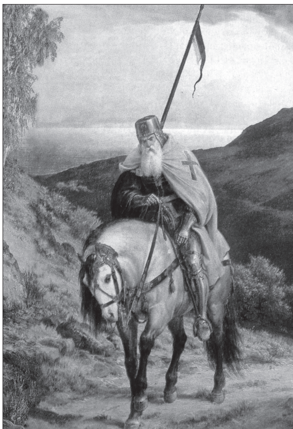
Visió idealitzada d'un templer, de Carl, F. Lissing.