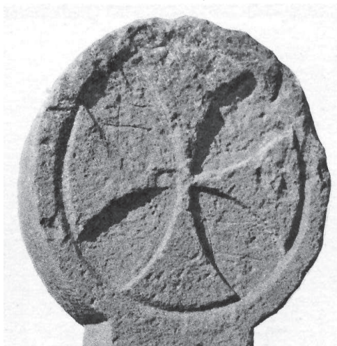
Creu dels Templers, segons E. Cirlot.

El negatiu resultant d'aquesta creu presenta l'únic exemple de flor de quatre pètals inserit dins un cercle. Aquesta creu consagrava els edificis cistercencs dedicats a la Verge Maria.