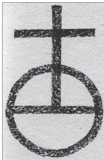
Representació gràfica del cercle i la creu, localitzat a Castellsalvà.