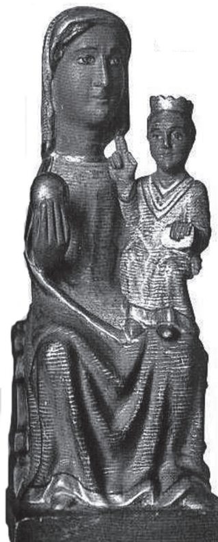
Verge de Santa Maria del Camí, comanda del temple de Granyena.

El negatiu resultant d'aquesta creu presenta l'únic exemple de flor de quatre pètals inserit dins un cercle. Aquesta creu consagrava els edificis cistercencs dedicats a la Verge Maria.