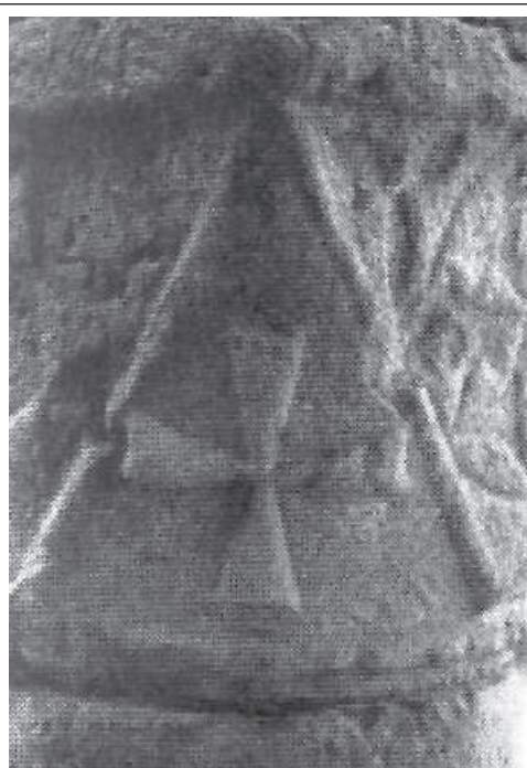
Capitell de Corbera d'Ebre amb creu aixamplada de tradició visigòtica.