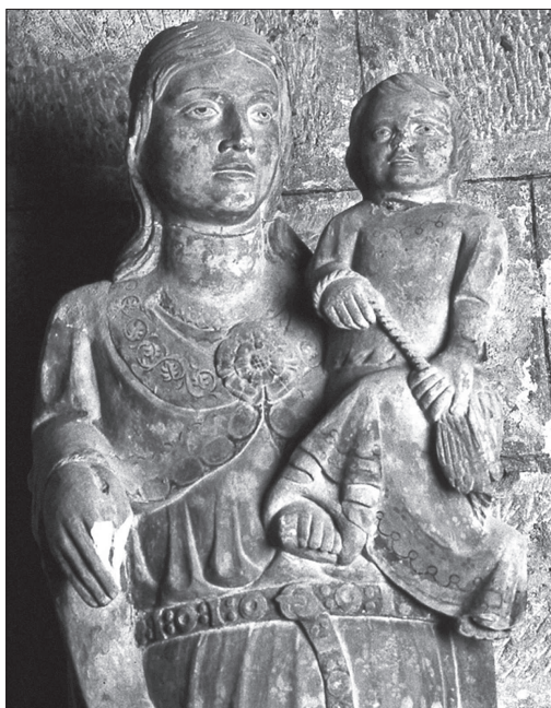
Verge de Gardeny, finals del Segle XIII.