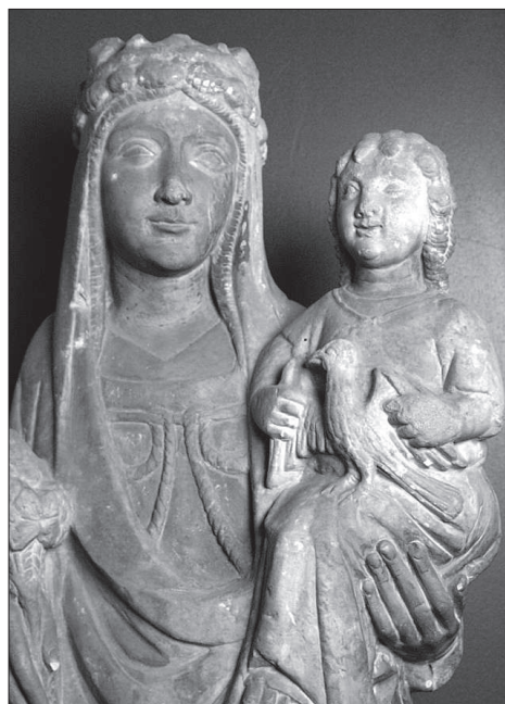
Verge Mestre d'Ager? Mitjants del segle XIV.

Resseguiu el simbolisme de la corda, antigament el «Flumem Dialis» o alt sacerdot romà de Júpiter, no podia portar nusos en la seva vestimenta, com tampoc els peregrins musulmans que anaven a la Meca 72 . S'interpretava que l'home religiós s'havia de presentar davant dels llocs sagrats deslligat de qualsevol lligam terrenal i es versava que un nus a les vestimentes podia provocar una obstrucció de la fluïdesa natural de l'espiritualitat de l'home vers Déu. En aquest sentit, Alexandre Vignati proposa que el nus dels templers s'hauria de concebre com un nus d'amor 73 . Com el nus corredor, -interpretat com a signe de l'infinít (8 horitzontal)- que esta format per un entrellaçat que no oprimeix 74 . Un veritable nus d'amor.