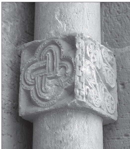
Nus de Salomó, església de Santa Maria de Bell-lloc. Queralt.

Sens dubte, a casa nostra tenen especial significació aquells símbols de regust oriental que alhora es poden relacionar amb el mític monarca i el seu temple. Bàsicament ens hauríem de referir al Nus de Salomó, al Segell de Salomó o estrella de David. En alguns casos, com l'ermita de Sant Bartolomé de Rio Lobos, a Soria, s'ha volgut introduir en el context templer l'estrella de cinc puntes. Però hem de deixar clar que