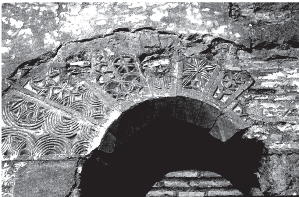
Porta-finestra Sud, del castell templer de Monzó.