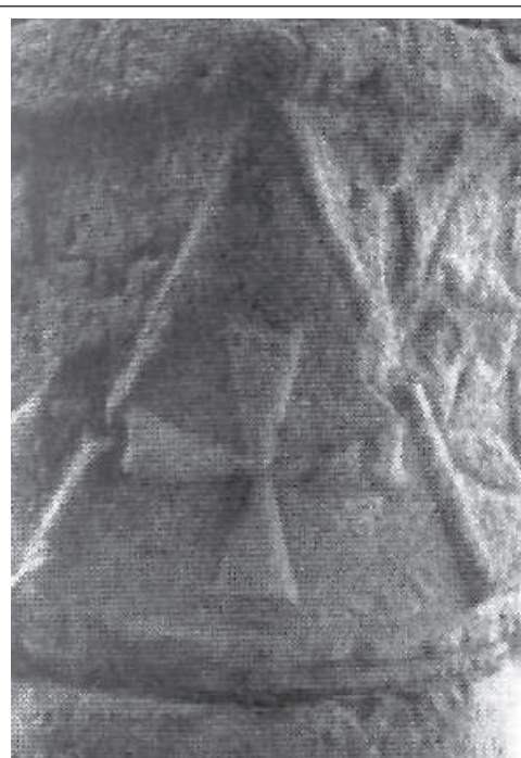
Capitell de Corbera d'Ebre amb creu aixamplada de tradició visigòtica.

Si ens fixem en els capitells del castell templer de Corbera d'Ebre, entre altres exemples, ens adonem que la creu se'ns presenta plana amb els braços eixamplats 31 . Se'ns dubte, ens trobem davant d'una tipologia de creu d'antiga tradició visigòtica que encara és arrelada en el país. En altres indrets, com l'església de Santa Maria la Blanca, de Villalcázar de Sirga, a Palència, trobem representat en el sepulcre de l'Infant Felip a varis cavallers templers amb l'hàbit i la creu vermella 32 , però la seva tipologia és més pròxima a la creu llatina amb els braços rectes. Sí ens atenem al simbolista, Eduard Cirlot, segons ell la creu del temple és de braços eixamplats amb vores convexes 33 . En canvi, en una miniatura de l'època, trobem la figura de fra Jaume d'Ollers, procurador del rei