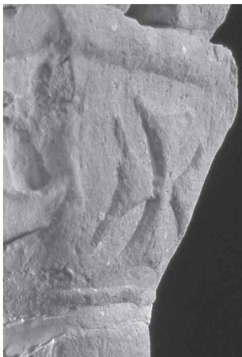
Capitell de Corbera d'Ebre amb creu aixamplada amb vora còncau.