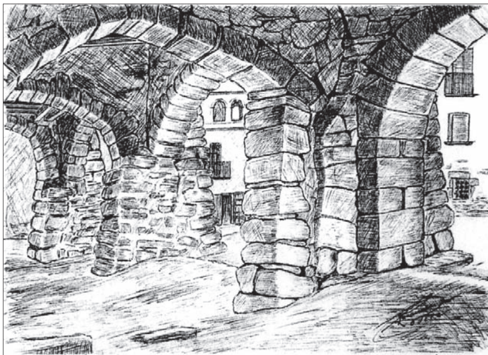
Quadre a la ploma de Ramon Rovira. Com sempre un tema d'Anglesola.

Sempre com hem dit abans amb algun raconet d'Anglesola, aquest poble que tant va estimar el Rovira.