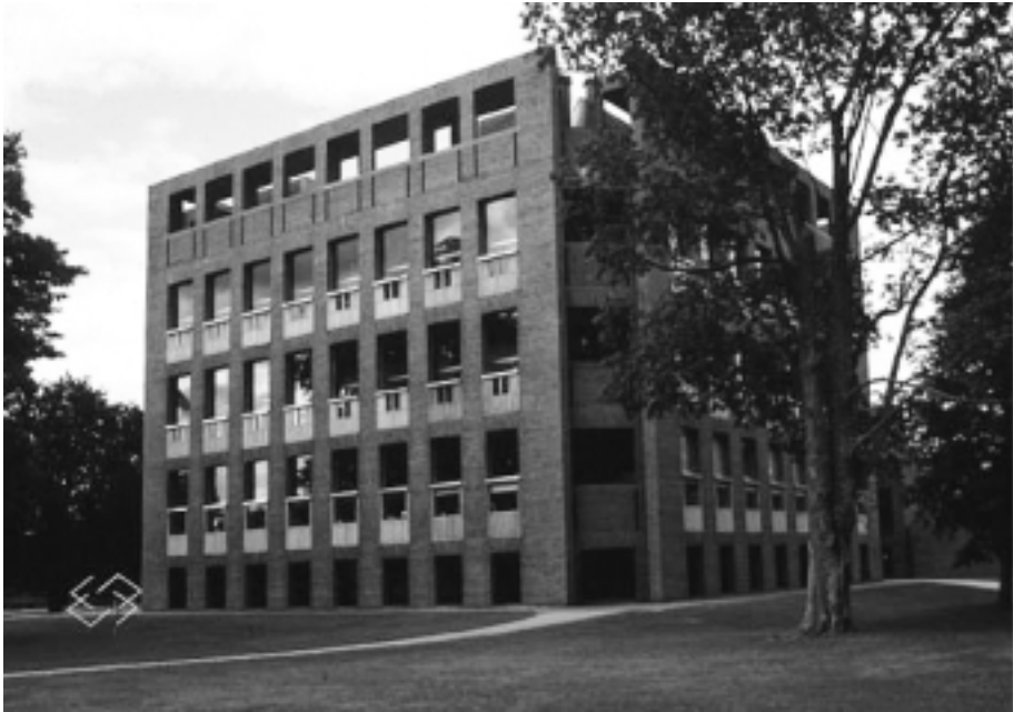
Exterior de l'Exeter Library