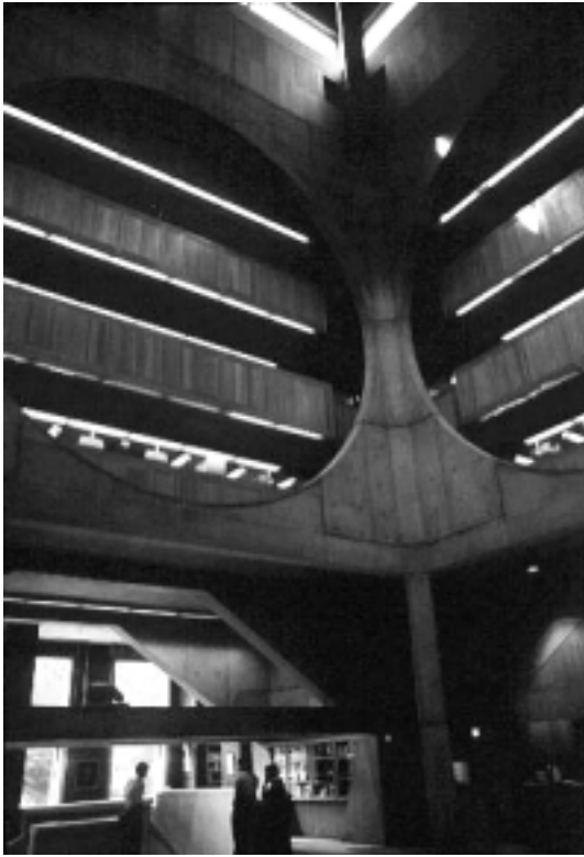
L'espai central, amb els gran cercles simbòlics que deixen veure els llibres i que conviden a entrar-hi

la seva lectura. Així, el vestíbul d'accés i la zona interior, el contenidor dels llibres —visibles des de l'escala— havien de representar simbòlicament aquesta ascensió cultural.