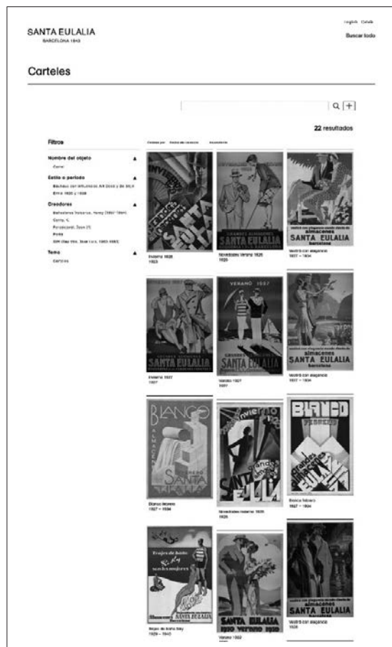
Figura 3: Part de la col·lecció de cartells digitalitzats de Santa Eulàlia

L'equip de Nubillum ha treballat molt de prop amb Àdhoc, empresa especialitzada en digitalització, a la qual s'envia el material amb una identificació prèvia, així com totes aquelles anotacions a tenir en compte en digitalitzar: