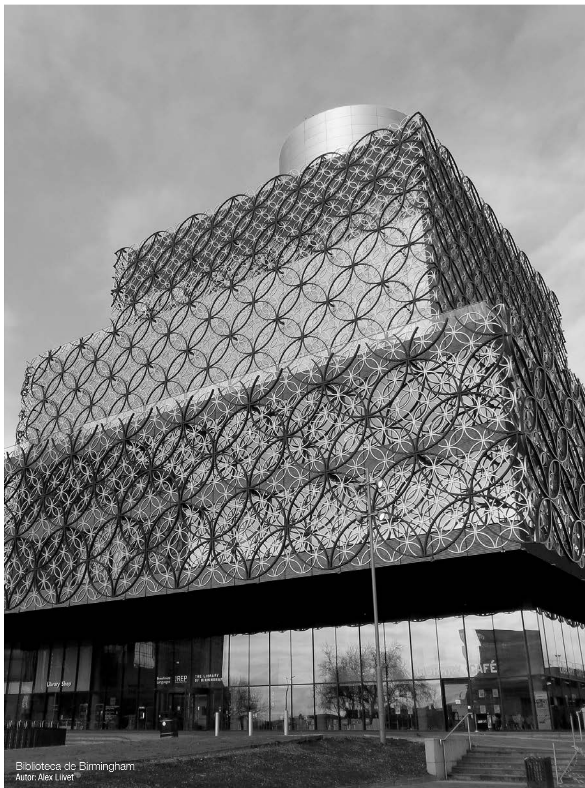
Biblioteca de Birmingham Autor: Alex Liivet