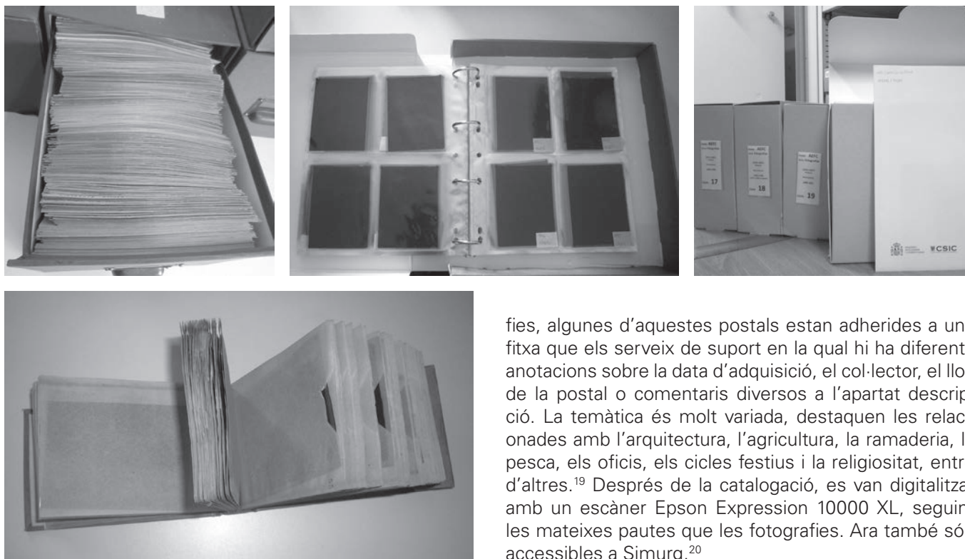
Figures 6, 7, 8 i 9. Estat de la documentació abans i després del tractament.

colors cada 300 imatges escanejades. Com que el servidor de Simurg és als serveis centrals del CSIC a Madrid, es van enviar les digitalitzacions a la Unidad de Recursos de Información Científica para la Investigación, on les van processar i les van incloure en aquesta plataforma.