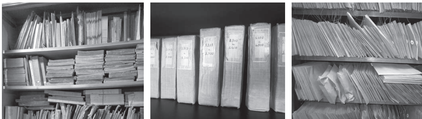
Figures 1, 2 i 3. Estat original de la documentació de l'AEFC.