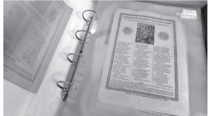
Figures 10 i 11. Estat dels documents abans i després de la intervenció realitzada.