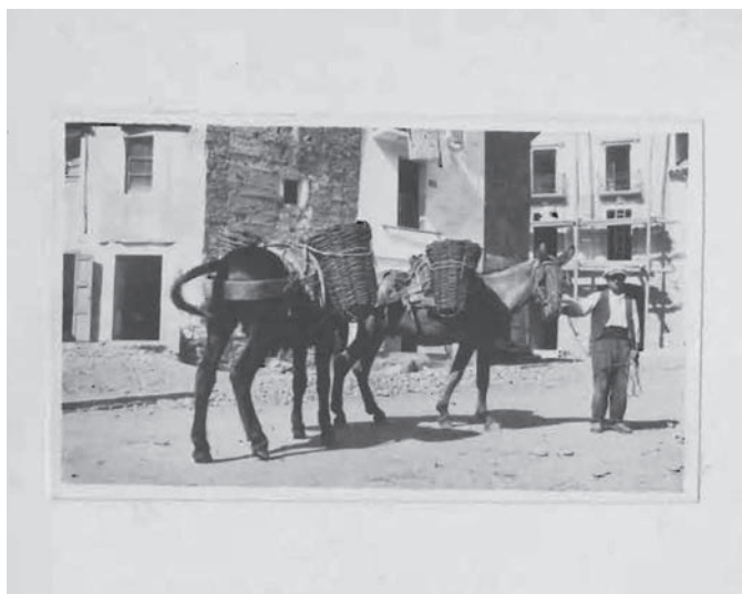
Figures 4 i 5. Exemple de positiu amb la fitxa d'informació adjunta.

origen, són majoritàriament de Catalunya, mentre que la resta corresponen a altres regions d'Espanya, països d'Amèrica, Europa, Àfrica i Àsia. També hi ha documents sense localització geogràfica. D'altra banda, tenint en compte la descripció, podem identificar les següents matèries: arquitectura, agricultura, ramaderia, oficis, cicles festius, religiositat, etc.