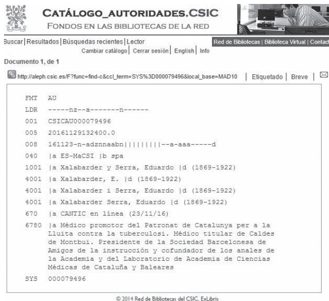
Figura 12. Exemple de registre d'autoritat.

autor secundari (etiqueta 700) especificant la seva funció (col.). A causa de l'estructura de les respostes, que sovint formen grans unitats compostes de tipologia molt diferent, s'ha fet una descripció del contingut tan detallada com ha estat possible (etiqueta 505).