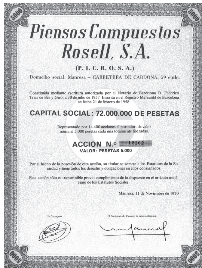
Acció de l'empresa Pínsos i Compostos Rosell SA, Manresa, 1970 (fons ACBG30-192).

Per acabar, cal assenyalar que, tot i que d'una manera molt més parcial, el fons també inclou documentació constitutiva (actes i estatus de Pícosa), així com dels òrgans de govern (Junta d'Accionistes i Consell d'Administració), la direcció de l'empresa (correspondència i actes de notaries), la gestió del patrimoni (béns immobles i màquines) i dels recursos humans (sobretot relativa a les remuneracions del personal).