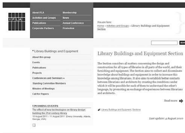
Figura 6. IFLA – Library Buildings and Equipment Section