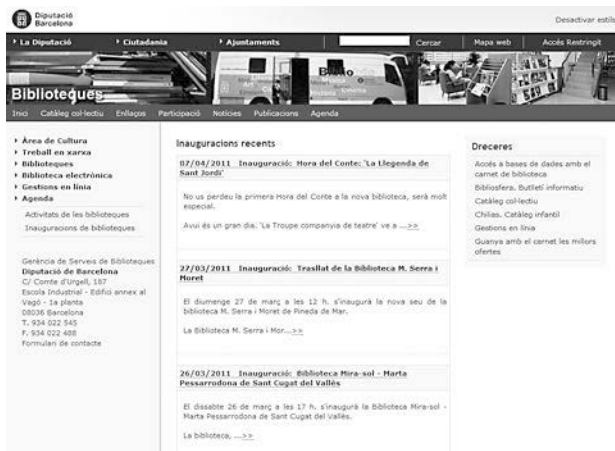
Figura 7. Agenda d'inauguració del Servei de Biblioteques de la Diputació de Barcelona

del llibre ( www.zhbluzern.ch/LIBER-LAG/lagepub.htm ). Cal dir, però, que no hi ha cap opció de rebre automàticament novetats sobre el LAG, ja sigui per RSS o per alertes de correu electrònic.