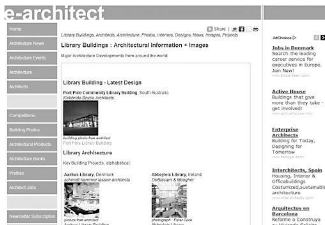
Figura 3. E-architect – Library buildings

relacionats amb la construcció i el disseny de biblioteques. I com no podia ser d'altra manera, també ens hi podem subscriure mitjançant l'RSS ( www.designinglibraries.org.uk/news/rss ), i es pot triar entre els feeds de les últimes notícies, els esdeveniments, les últimes biblioteques afegides a la base de dades o les últimes imatges incloses a la galeria d'imatges.