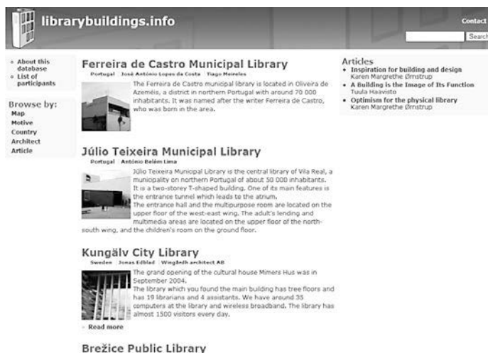
Figura 1. Librarybuildings