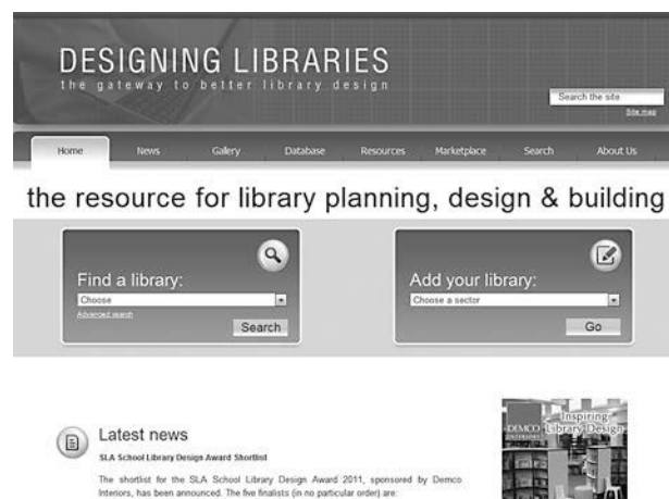
Figura 2. Designing Libraries

(façana principal, interior, sales de lectura, etc.), per país i per arquitecte. Un cop dins de cada fitxa amb la descripció de cada biblioteca, hi trobem els següents camps: una petita introducció de la localització i l'entorn de la biblioteca, l'enllaç a la web de la biblioteca, l'any de finalització, la superfície, l'adreça, la categoria, un enllaç amb més informació sobre l'edifici, la descripció arquitectònica, el proveïdor de mobiliari i el cost total de l'obra.