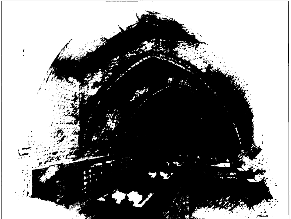
Sala de lectura de l'ala de llevant

e) Equipament complementari: és el conjunt de tots aquells serveis que completen i enriqueixen l'oferta d'ús de la Biblioteca de Catalunya: sala