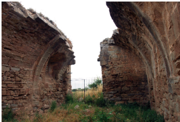
Detall de l'enderroc d'una de les voltes de l'Obra de Fluvià, probablement atribuïble als vilatans de Guissona en el context de la Guerra del Francès

Durant la segona Guerra Carlina, Rafel Tristany entrà a Guissona l'abril de 1848, fent enderrocar les fortificacions de la vila. De nou amb la tercera d'aquestes guerres, pel setembre de 1872 està documentada una