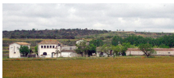
Dependències de Tapioles el 2013, que formen part de la façana d'entrada al complex