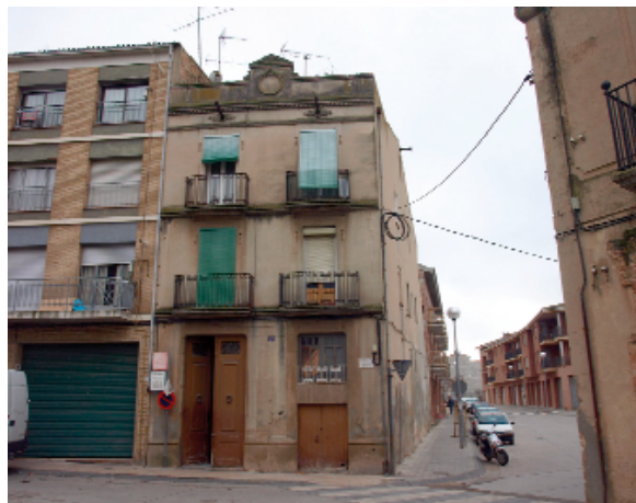
En primer terme cases del Raval Bisbal, mentre que al fons es veuen construccions d'època moderna, segle XX i XXI

Al segle XVIII la vila tingué un notable creixement