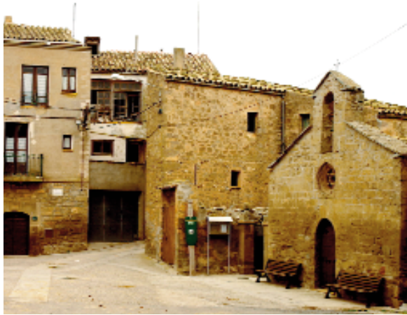
Plaça de l'Església, amb cal Putxet i l'església de la Mare de Déu de la Llet

menor. Poc després, el 1172, Ramon d'Artesa el deixà en testament al seu fill Ramon, perquè el tingués pel bisbe i la canònica d'Urgell. El 1187 Gombau de Guissona deixava al seu hereu Pere els castells de Guissona i de Guarda-si-venes. També els Alta-riba tingueren béns i drets a Guarda-si-venes. Al segle XIII la Seu Episcopal d'Urgell hi tenia propietats.