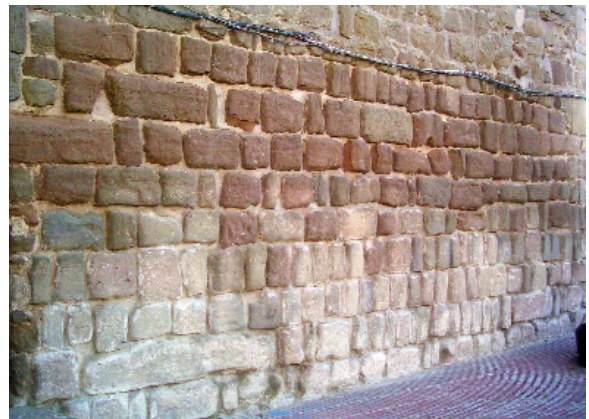
Tram de l'antiga muralla medieval a la plaça Vell Pla

Els nuclis que sorgeixen al voltant de Guissona en aquest segle XI són ser molt petits i solen aparèixer amb la denominació de quadres, sent totalment