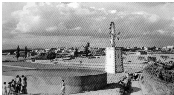
Vista de Guissona des de la Font de la Salut el 1955, amb el molí i la bassa del Vaqué en primer terme

demogràfic i també es produí una certa millora econòmica que possibilità l'obertura dels diferents ravals que circumden el nucli antic de la vila. A partir de la segona dècada del segle XX Guissona torna a tenir un fort increment demogràfic, que a nivell urbanístic es detecta en la construcció de moltes cases i torres modernistes en carrers com el carrer Bisbal o, als ravals ja existents. També en noves avingudes com la de l'Onze de Setembre, Dr. Pere Castelló, o de la Generalitat, algunes d'aquestes d'una gran qualitat estètica. A partir dels anys cinquanta del segle XX i ja entrat el segle XXI, Guissona no ha parat de créixer i, per tant, noves construccions han anat eixamplant el seu perímetre, urbanitzant nous espais.