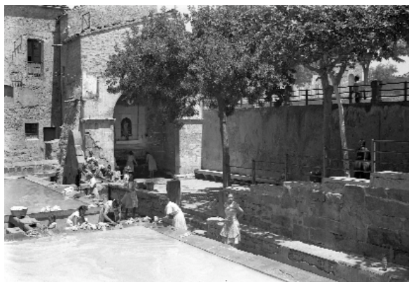
La font de la Vila i el safareig als anys cinquanta

Molí de la Teresa (o Molí de Dalt); ambdós deixaren de funcionar ja entrat el segle XX. A Tapioles també funcionaren dos molins. Tots quatre agafaven l'aigua de la Font de l'Estany i del Passarell.