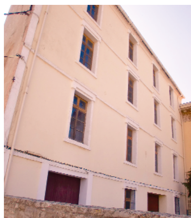
Edifici on antigament estava instal·lada la Farinera Balcells