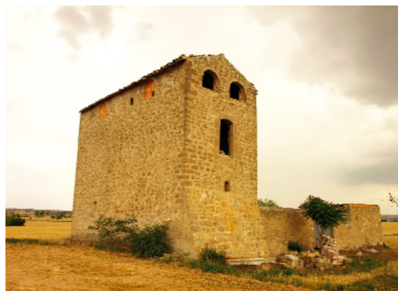
Al segle XIX les Guerres Carlines foren molt cruentes a la Segarra. La Torre d'en Carlos fou espectadora privilegiada d'aquests esdeveniments

A finals del segle XVIII Rafael d'Amat i de Cortada, baró de Maldà, descriu Guissona de la següent manera en el seu llibre Viles i ciutats de Catalunya : "La mencionada vila de Guissona és medianament gran en caseria, ab lo palàcio vell del senyor bisbe de la Seu d'Urgell, penso mitg a no tot casi derrhit; medià lo número de sos habitants (...) Queda Guissona situada en planura però, no obstant poder-se dilatar la vista, lo recinto de la vila és més trist que alegre...".