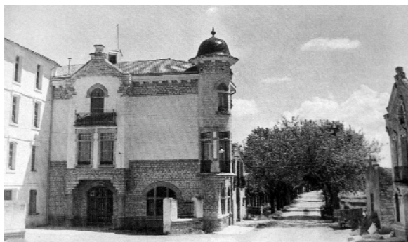
L'habitatge de la Farinera Balcells exemplifica l'augment de l'activitat econòmica de Guissona durant el primer terç del segle XX

forta presència carlina que bloquejava els camins per on passaven les forces liberals des de Solsona, Cervera o Guissona.