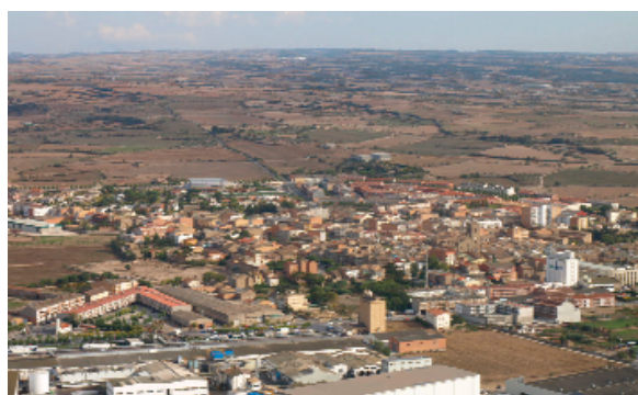
Imatge aèria de Guissona, amb les naus de la CAG en primer terme

La ciutat de Guissona es troba al centre de la plana que porta el seu nom, que s'estén entre els vessants poc pronunciats dels rius Llobregós i Sió i que abraça els municipis de Guissona, Sant Guim de la Plana, Massoteres, Torrefeta i Florejacs i Tarroja. La vila en si s'aixeca a l'esquerra de la riera de Passerell. Amb una extensió de 18,2 km 2 , és un dels municipis més petits en extensió de la Segarra. Comprèn el terme de Guissona, amb el poble de Guarda-si-venes i l'enclavament de Mas d'en Porta.