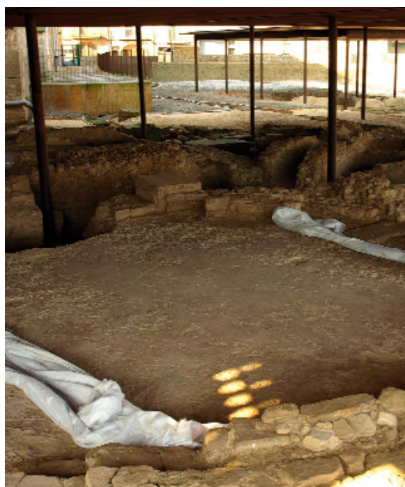
Vista parcial de les excavacions que estan traient a la llum l'antiga Ilesso, una de les ciutats més importants que tenien els romans a l'interior de la Tarraconense

Ara sabem, fins que noves dades puguin aportar algun canvi, que els primer pobladors que s'establiren en el que avui és Guissona ho feren a l'Edat del Bronze, cap al 800 aC, dels quals s'ha localitzat l'enterrament col·lectiu de la Bauma de l'Auditori. Ja entre finals de l'Edat del Bronze i primers de l'Edat del Ferro (entre el 650 – 500 aC) s'hi estableix un nou grup humà, ja que aquí trobaren un terra fèrtil que els permetia conrear i l'abundància d'aigua que emergia en forma de fonts garantia la supervivència humana. Aquests nous pobladors s'instal·laren en el que avui és la plaça de VellPla, a tocar de l'actual Font de la Vila. D'aquest primer grup sabem que no coneixien l'escriptura, que ja començaren a utilitzar eines de ferro i que incineraven els cadàvers.