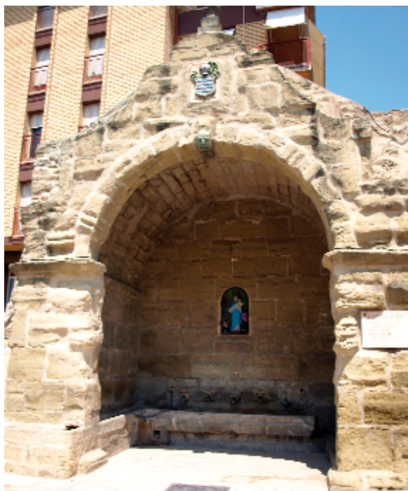
La Font de la Vila l'any 2012

La comarca de la Segarra tingué una primera ocupació humana durant el Neolític mitjà, amb grups que s'assentaven prop de corrents d'aigua, eren comunitats agrícoles i utilitzaven sepultures de fossa.