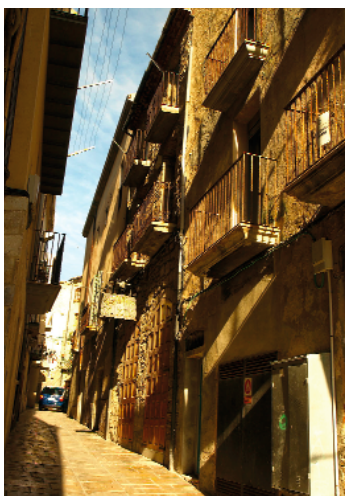
Un altre dels carrers emblemàtics de la vila, el carrer de Santa Margarida. Exemple del traçat urbà medieval

Quan l'any 1013 el papa Benet VIII confirmà els béns de l'església d'Urgell, encara no es fa constar el castell de Guissona, per tant aquesta ciutat i la seva plana degué ser conquerida i repoblada entre