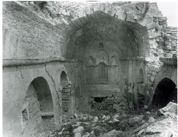
Capella de l'Obra de Fluvia. Estat de la coberta de volta a començament segle XX