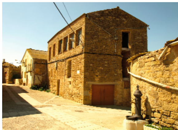
Espai urbà del nucli de Guarda-si-venes