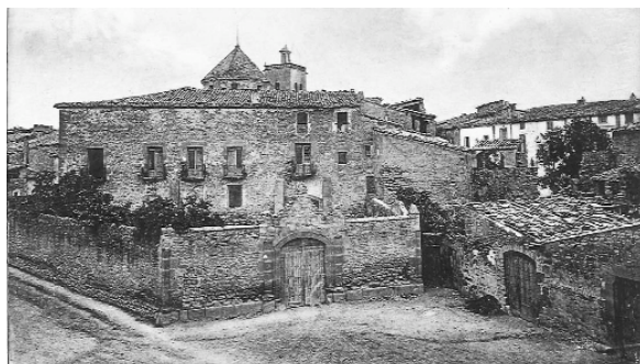
Aspecte de l'antic Palau Episcopal abans de la seva cessió a l'Ajuntament de Guissona a començament s. XX

dependents de la població de Guissona; malgrat aquest domini de Guissona sobre la resta de pobles de la comarca, no recuperarà la categoria de ciutat que havia tingut en època romana. Segurament el més important d'aquests nuclis perifèrics seria el de Fluvià, castell que donà lloc a la família que portaria aquest nom, la qual havia jugat un paper força important en la conquesta de tot aquest sector. Els Fluvià emparentaren amb algunes de les millors famílies nobles catalanes i donaren grans personatges a la nostra història; la branca que mantingué el senyoriu del castell de Fluvià es mantingué fins al segle XIV, quan Blanca de Fluvià, casada amb Berenguer Sacosta, el 1380 es ven-