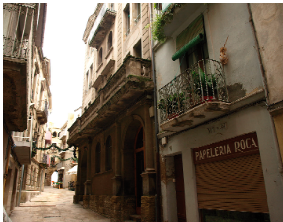
El carrer de la Font era una de les artèries vials de la vila medieval

Guissona, que és la segona població de la Segarra en nombre d'habitants, també disposa d'un important comerç i indústries de diferents rams; per sobre de totes en destaca la CAG (Corporació Alimentària de