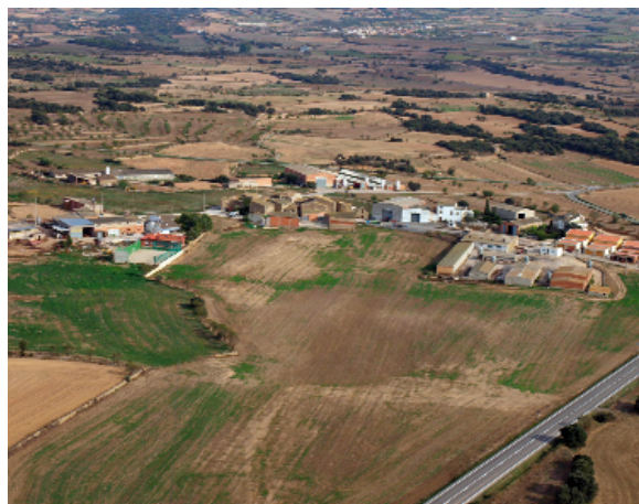
Vista aèria del petit nucli de Guarda-si-venes

Situat al nord-oest de Guissona i en terreny pla. Ceferí Rocafort explica en el seu llibre de 1910, que Guissona es troba: "... al extrem NE de la conca del Ció. Consta de 418 edificis reunits, 10 en lo caseriu de Guardasivenes ...".