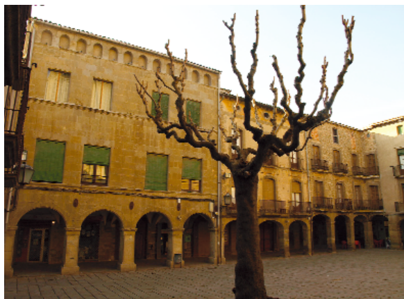
Plaça Major de Guissona. En primer terme ca l'Erill, del s. XVI/XVII, i al fons edificis amb elements dels segles XVII i XVIII

dependents de la població de Guissona; malgrat aquest domini de Guissona sobre la resta de pobles de la comarca, no recuperarà la categoria de ciutat que havia tingut en època romana. Segurament el més important d'aquests nuclis perifèrics seria el de Fluvià, castell que donà lloc a la família que portaria aquest nom, la qual havia jugat un paper força important en la conquesta de tot aquest sector. Els Fluvià emparentaren amb algunes de les millors famílies nobles catalanes i donaren grans personatges a la nostra història; la branca que mantingué el senyoriu del castell de Fluvià es mantingué fins al segle XIV, quan Blanca de Fluvià, casada amb Berenguer Sacosta, el 1380 es ven-