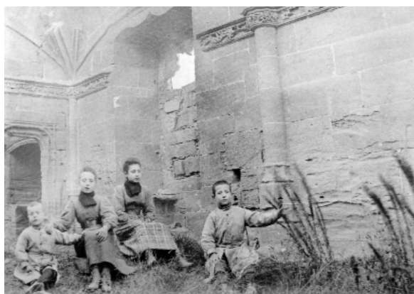
Aspecte de l'Obra de Fluvià en una imatge de principi segle XX

qué el senyoriu de Tapioles i el 1383 el de Fluvià; aquest fou comprat el 1389 entre la Universitat de Guissona, la canònica de la mateixa ciutat i les Universitats de Torrefeta, Ossó de Sió i del poble de Fluvià. Quan el 1505 el bisbe d'Urgell Pere de Cardona adquirí la jurisdicció del lloc per construir una residència, les restes de la qual es coneixen amb el nom d'Obra de Fluvià, una de les condicions del contracte era que havia d'enderrocar l'antic castell de Fluvià. L'actual terme de Guissona i part de la mateixa vila s'aixeca sobre la terra on antigament havien existit els pobles de Fluvià, Vilamur, Tapioles, Nial, Robiol i Bisbal, noms que encara sobreviuen en la memòria col·lectiva lligats a noms de partides o de carrers.