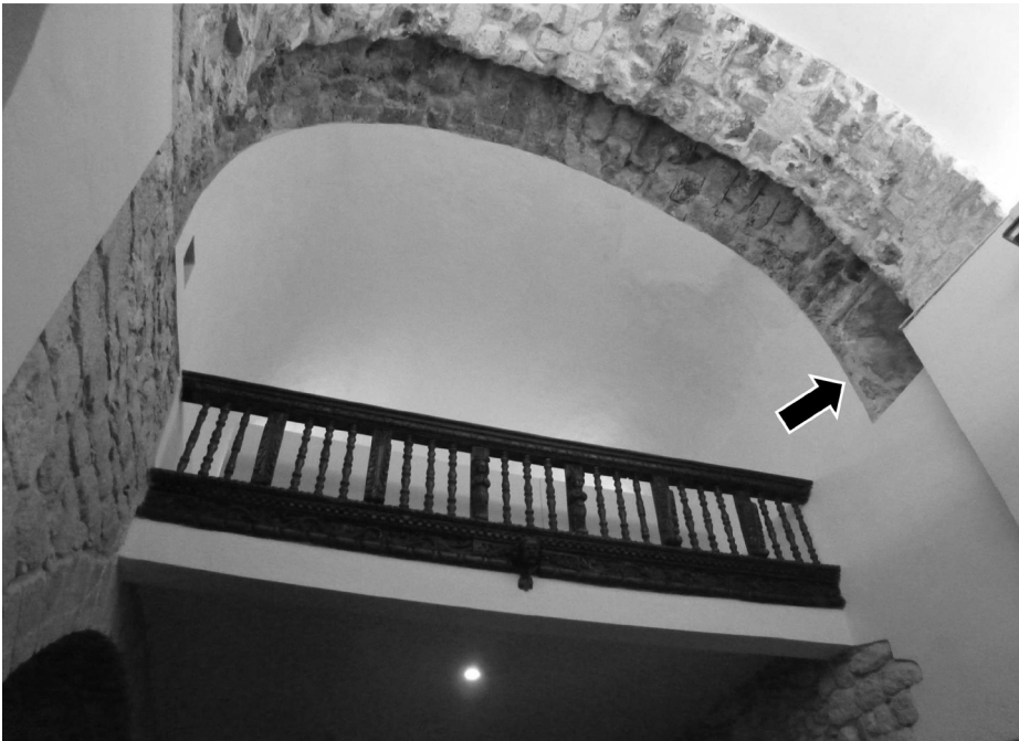
Cor actual de l'església de Santa Maria d'Organyà. A mà dreta s'obre el passadís on es troba el gravat.

recull la notícia arribada a Organyà de la celebració de la pau entre el rei Felip V d'Espanya, l'emperador Carles VI del Sacre Imperi i el rei Joan V de Portugal, pactada l'any 1725 i reforçada amb una sèrie d'acords matrimonials que haurien d'unir l'hereu de Felip V amb una neboda de l'emperador Carles VI, i una filla de Felip V amb el propi rei de Portugal. D'acord amb això, els actors principals que figuren en la inscripció són els reis Felip V d'Espanya i Joan V de Portugal, així com l'emperador Carles VI del Sacre Imperi, els quals serien els artífexs de la signatura d'aquesta pau, segons el text de la inscripció.