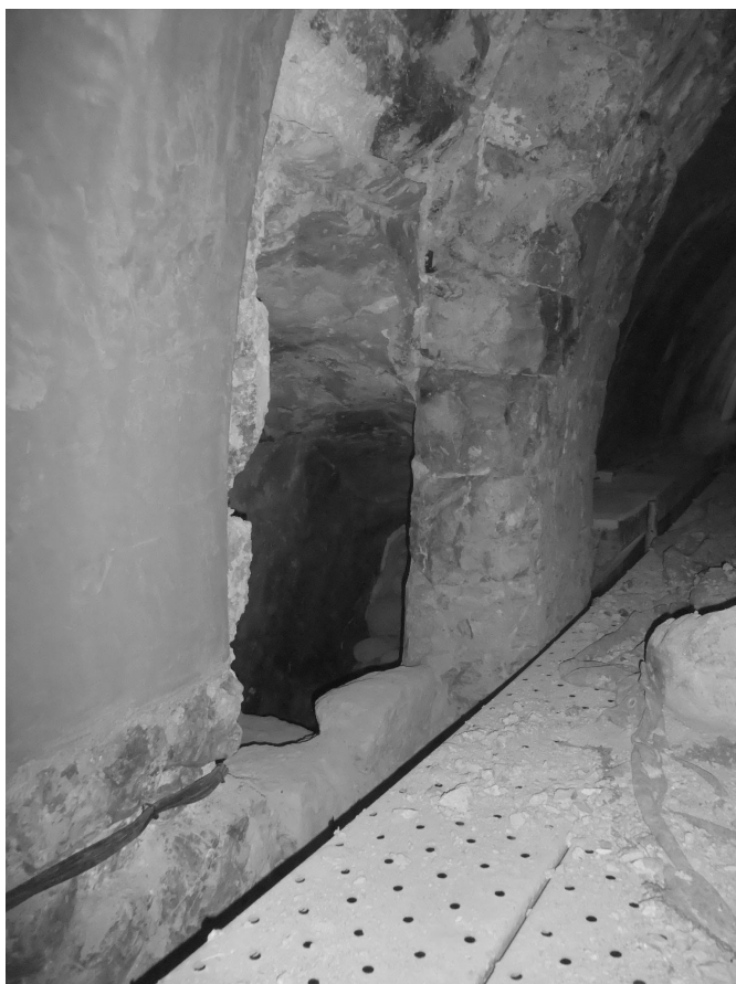
Aspecte del passadís durant les obres de rehabilitació de l'església, el febrer de l'any 2014.

reafirma en la nostra hipòtesi que el passadís seria aquest accés a la tribuna de l'orgue 41 . El fet que el gravat estigui acompanyat d'alguns altres de tipus econòmic (amb indicacions de dates i sous) ens porta a plantejar la hipòtesi que fos realitzat per l'organista o algun altre personatge vinculat a l'acompanyament musical de les celebracions litúrgiques de la canònica, sense que tinguem més dades per recolzar aquesta opció.