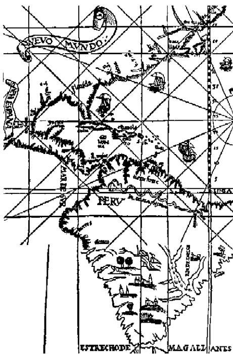
Mapa 1. Mapa del Nuevo Mundo, de Pedro de Medina. Grandezas de España . Sevilla, 1549. Cortesía de la Newberry Library. (Chicago, Estados Unidos).

gastos de la colonización, Colón llevó unos 550 taínos para que fueran vendidos como esclavos (1495). 13 Aunque tales acciones no significaban que Colón tuviera en