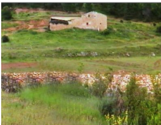
Masía El Oroque (Cofrentes)