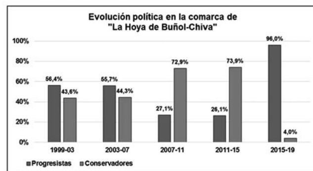
Figura 3. Evolución política en la comarca de “La Hoya de Buñol-Chiva”, durante los cuatro lustros que marcan desde 1999, hasta final de la legislatura que ahora comienza. Proporción de la población gobernada por partidos o coaliciones conservadores/progresistas.