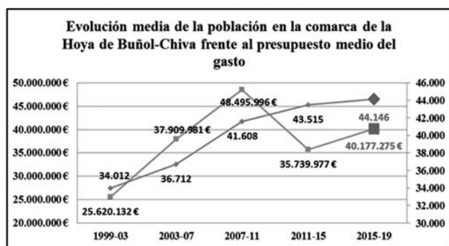
Figura 5. Evolución media de la población en la comarca de la Hoya de Buñol-Chiva, frente al presupuesto medio de gasto en producción de bienes públicos de carácter preferente, durante los cuatro periodos de tiempo señalados entre 1999 – 03 y el 2011 – 15, y la estimación de ambas variables para el periodo 2015 – 19 (Fuente: Elaboración propia a partir de los datos proporcionados por http://serviciosweb.meh.es/apps/EntidadesLocales/BDatos-PL.aspx ; y http://www.foro-ciudad.com/valencia ).

Si queremos tener una aproximación, al presupuesto del gasto realizado en cultura, por el Gobierno Central Español, durante los años 2012 al 2016, éste vendría a ser de 20,1€ (2012), 15,5€ (2013), 15,4€ (2014), 16,1€ (2015) y 17,4€ (2016) por habitante 10 (según datos de los Presupuestos Generales del Estado Consolidados – 2016). Sin embargo, si esos datos del gasto los extraemos del presupuesto liquidado de cada ejercicio, se reducen significativamente quedando en 16,5€ (2012), 13,5€ (2013), 14,6€ (2014) y 14,5€ (2015) por habitante 11 (fuente: MECD).