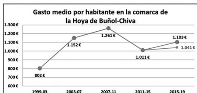
Figura 4. Evolución del gasto medio por persona en la comarca de la Hoya de Buñol-Chiva.

hecho coincidir con los periodos electorales) considerados, tanto los del área de “producción de bienes público de carácter preferente” (una vez homogeneizada toda la muestra considerada), por cada una de las cuatro políticas que componen el área (sanidad, educación, cultura y deportes), como los presupuestos medios globales de todas las entidades locales de la comarca, podemos determinar la serie de porcentajes medios que se han gastado en cultura, durante los periodos considerados, tanto por parte de los partidos progresistas como los conservadores. Los cuales agregados convenientemente nos totalizarán el gasto/inversión de la comarca en cada concepto presupuestario.