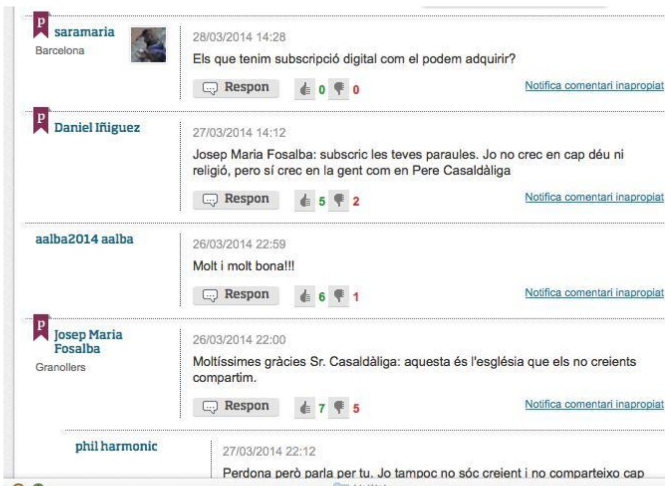
Figura 1: Comentarios en ARA

La principal herramienta para fomentar la participación de los usuarios con que cuentan estas webs de medios son los comentarios en noticias, blogs o artículos de opinión, así como la actividad en redes sociales desarrollada por el medio. Los comentarios son permitidos de forma mayoritaria sin ningún tipo de control previo. La moderación suele ser a posteriori de la publicación de los comentarios, y en casos en que se reporte por parte de los otros usuarios posibles abusos o uso inapropiado. Los usuarios pueden también votar o 'premiar' los comentarios de otros usuarios. En ningún caso se posibilita una comunicación directa entre usuarios (vía por ejemplo mensaje privado), limitando toda posible opción comunicativa a una relación usuario-medio (ver figura 1).