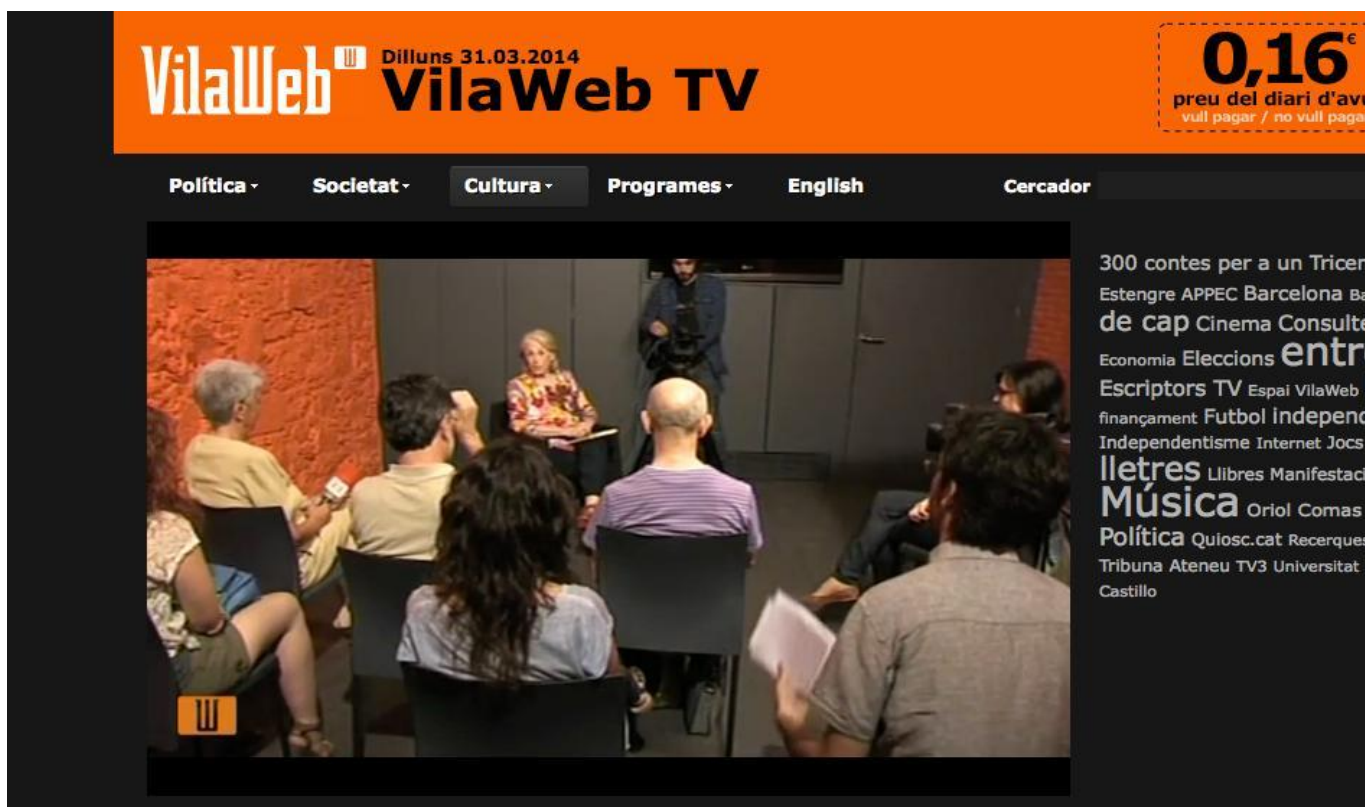
Figura 6: Suscriptores de Vilaweb realizan una entrevista en grupo en la redacción del medio

Eldiario.es tiene un funcionamiento parecido al de Vilaweb en lo que se refiere a vincular participación y contribución económica. Con una tarifa anual de 60 euros los suscriptores son invitados a encuentros periódicos con la redacción y sus comentarios son destacados de forma especial. Cabe destacar que en ambos casos, son medios con una línea ideológica muy marcada, lo que facilita una identificación entre el medio y aquellos usuarios que comparten la misma ideología.