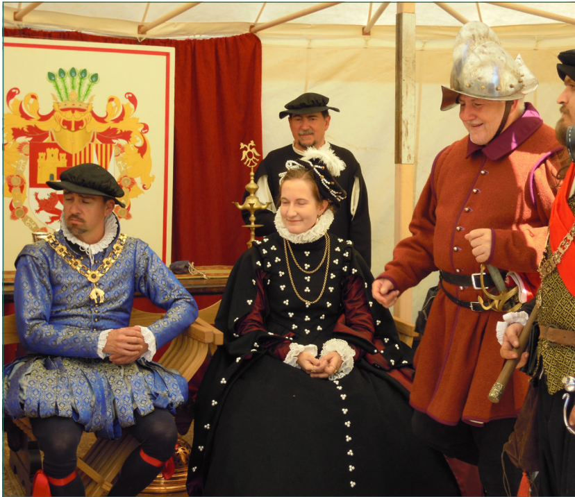
Figura 1. Detalle de recreación específica: Tienda de don Juan de Austria.