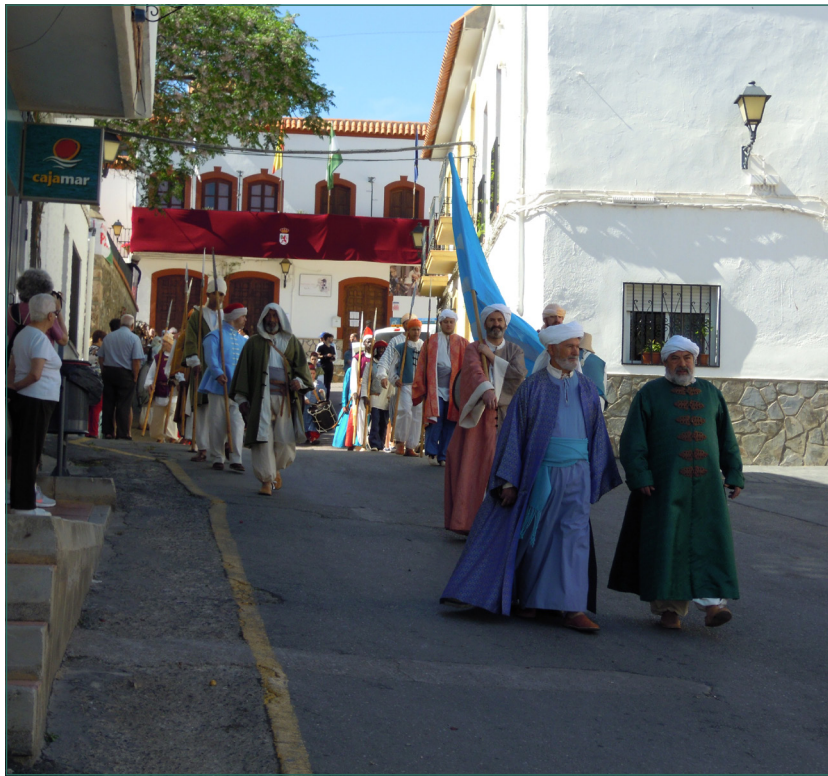
Figura 4. Desfile cívico: Las autoridades moriscas y sus tropas.

de tal manera que el vecindario tiene mayores incentivos en su cotidianeidad, incluso llegándose a realizar ciclos de cine histórico, excursiones a museos y ciudades patrimoniales, todo en un sentido de vida que trasciende al mero hecho histórico. Así las cosas, cuando un aula se decora con posters o fotografías de un hecho histórico, no se está haciendo sino algo que, ya en Padules, a nivel mucho más amplio, también se realiza. De modo que el espacio vivencial constituye un incentivo permanente y constante, de forma amable, para mantener el interés por un hecho histórico, en este caso, toda la etapa morisca.