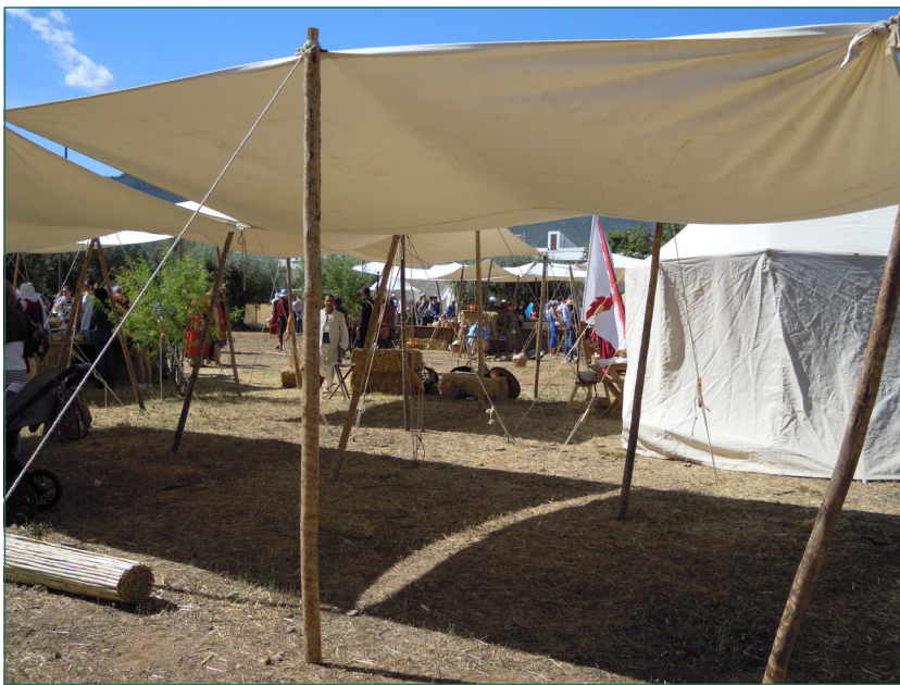
Figura 2. Panorámica del campamento (principal escenario) donde se realiza la recreación histórica de Padules.

senador romano, estableciendo para ello distintas fases de trabajo que, convenientemente desarrolladas, constituirán las pautas que proponemos más adelante para el diseño de una recreación compleja . Tomando como modelo la recreación histórica de Padules, donde se dan de forma simultánea varias recreaciones específicas , incluimos, por ejemplo, en la Figura 1, un detalle de la recreación específica de la tienda donde se instaló don Juan de Austria, cuando estuvo asentado en Padules junto a sus tropas (Figura 1).