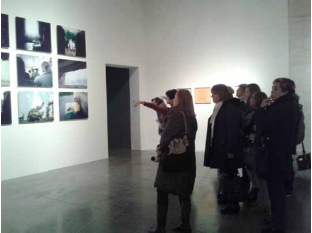
Figs. 3 y 4. Intervenciones con participantes de la Universidad de la Experiencia

Se trata de implementar, desde los estándares de calidad definidos en el proyecto OEPE EDU2009-09679, un proyecto educativo desarrollado en tres cursos académicos para determinar los procesos de patrimonialización e identificación (Gómez, 2013) generados a partir de la enseñanza de la cultura contemporánea, con especial interés en el arte de nuestros días.