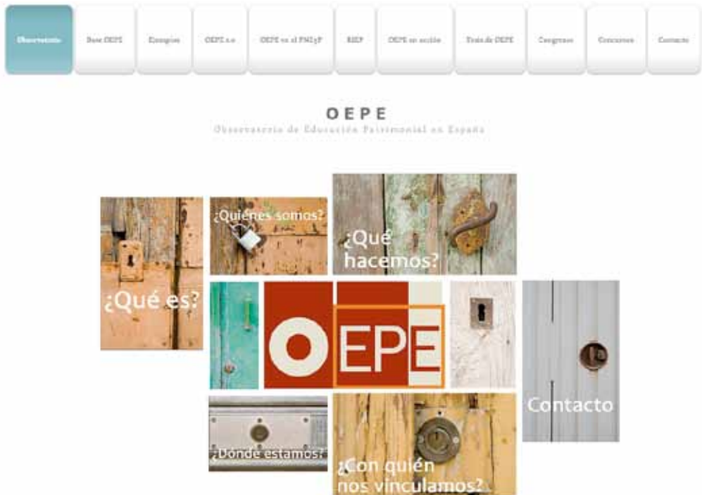
FIG. 2. Web del Observatorio <www.oepe.es>

ficación (implementación) y, por último, la calidad y la utilidad de los resultados e impactos generados para su difusión (Fontal y Juanola, 2015).