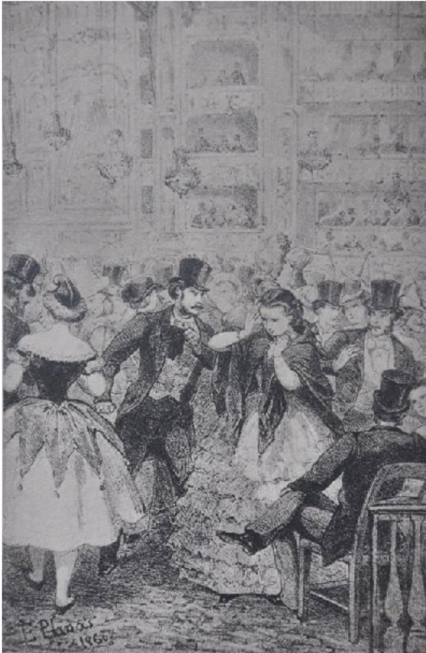
Il·lustració litogràfica d'Eusebi Planas per a la novel·la Barcelona y sus misterios (1860), que representa el pati de butaques del Liceu de Barcelona, abans del seu primer gran incendi

al final de la novel·la, de nou per contraposició dels estils de vida: «De què un hom que des del matí al vespre va com un gos darrera del seu treball, tinga que esmerçar lo que tant li costa, pels que, amb un parell d'hores al dia, i al vespre tot sentint los refilets de les dives que canten al Liceu, ja han fet lo seu jornal...». 73