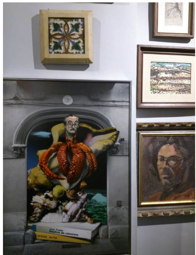
Donació d'artistes a l'Espai Joan Fuster