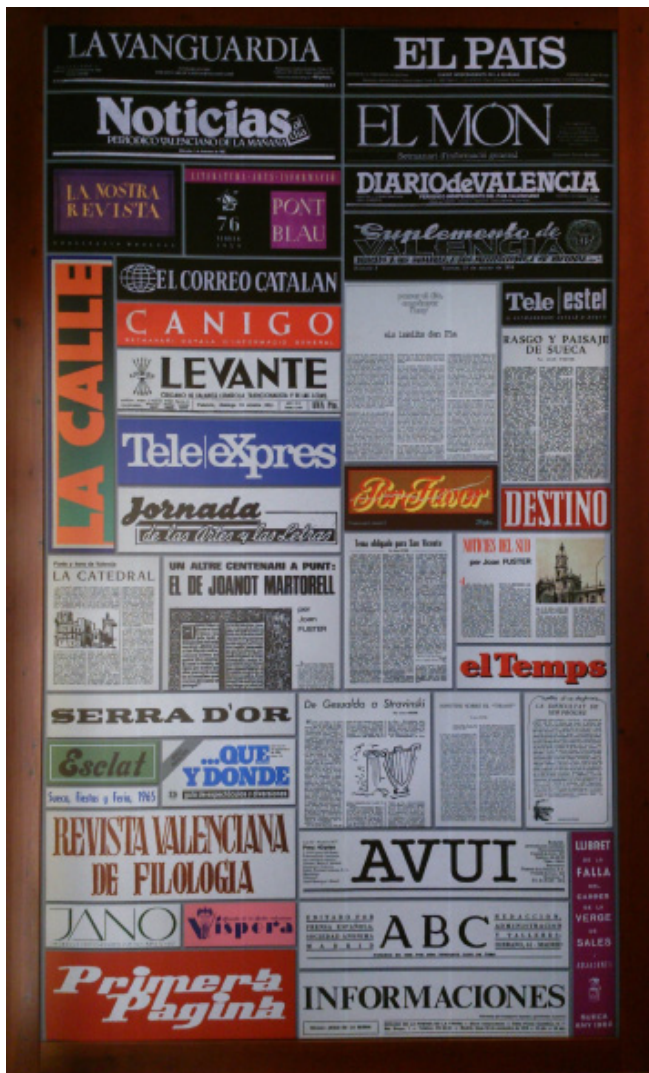
Rètols dels periòdics i revistes on va publicar Joan Fuster