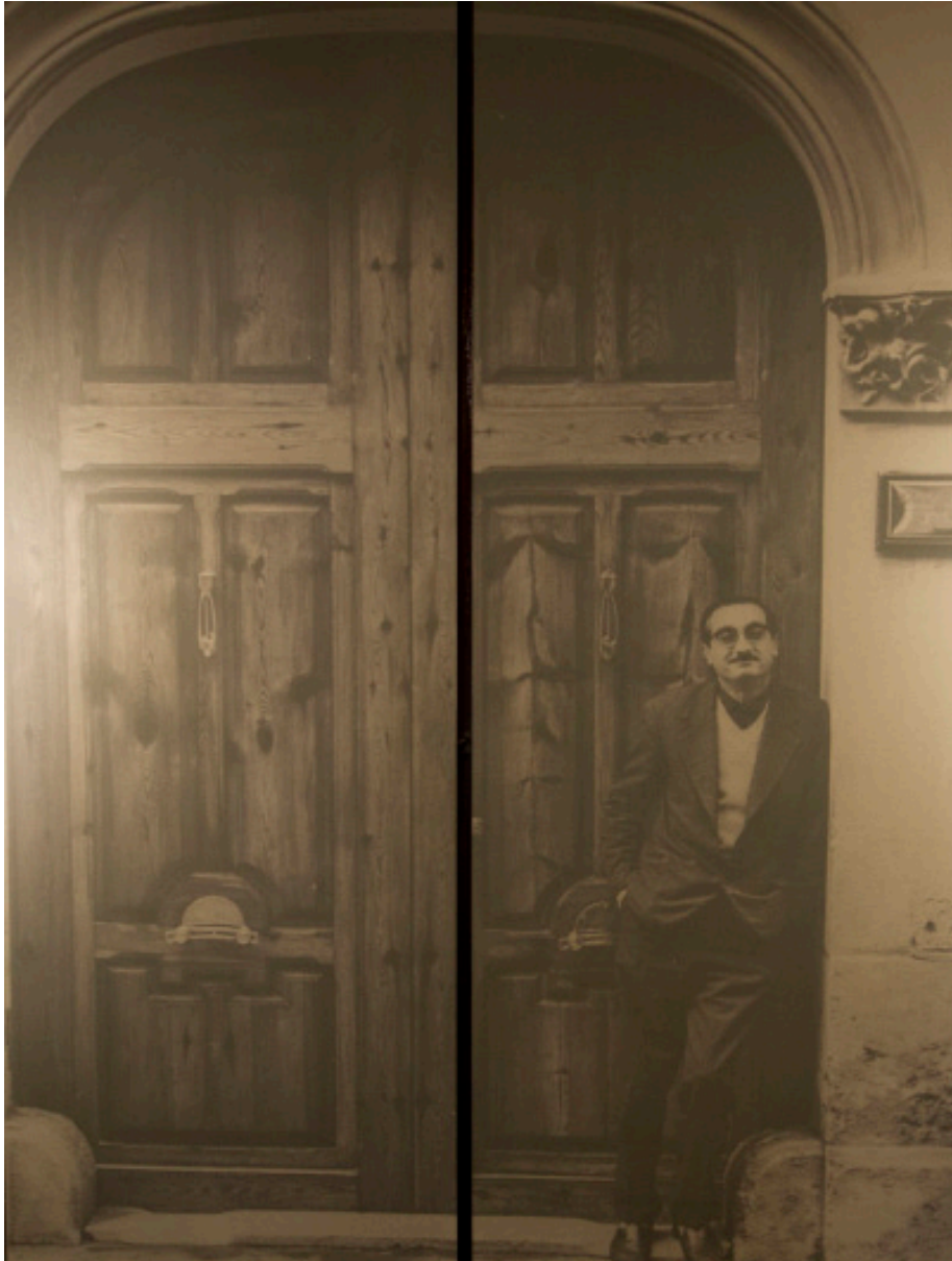
Joan Fuster davant l'entrada de la casa

Una part curiosa del museu és el photo call que han muntat a la part principal de la casa, on un Joan Fuster a mida real està esperant per fer-se les fotos amb el visitant. Hi ha el punt afegit que, quan la gent penja aquestes fotos a les xarxes socials, ajuda de retruc a fer més difusió de la figura.