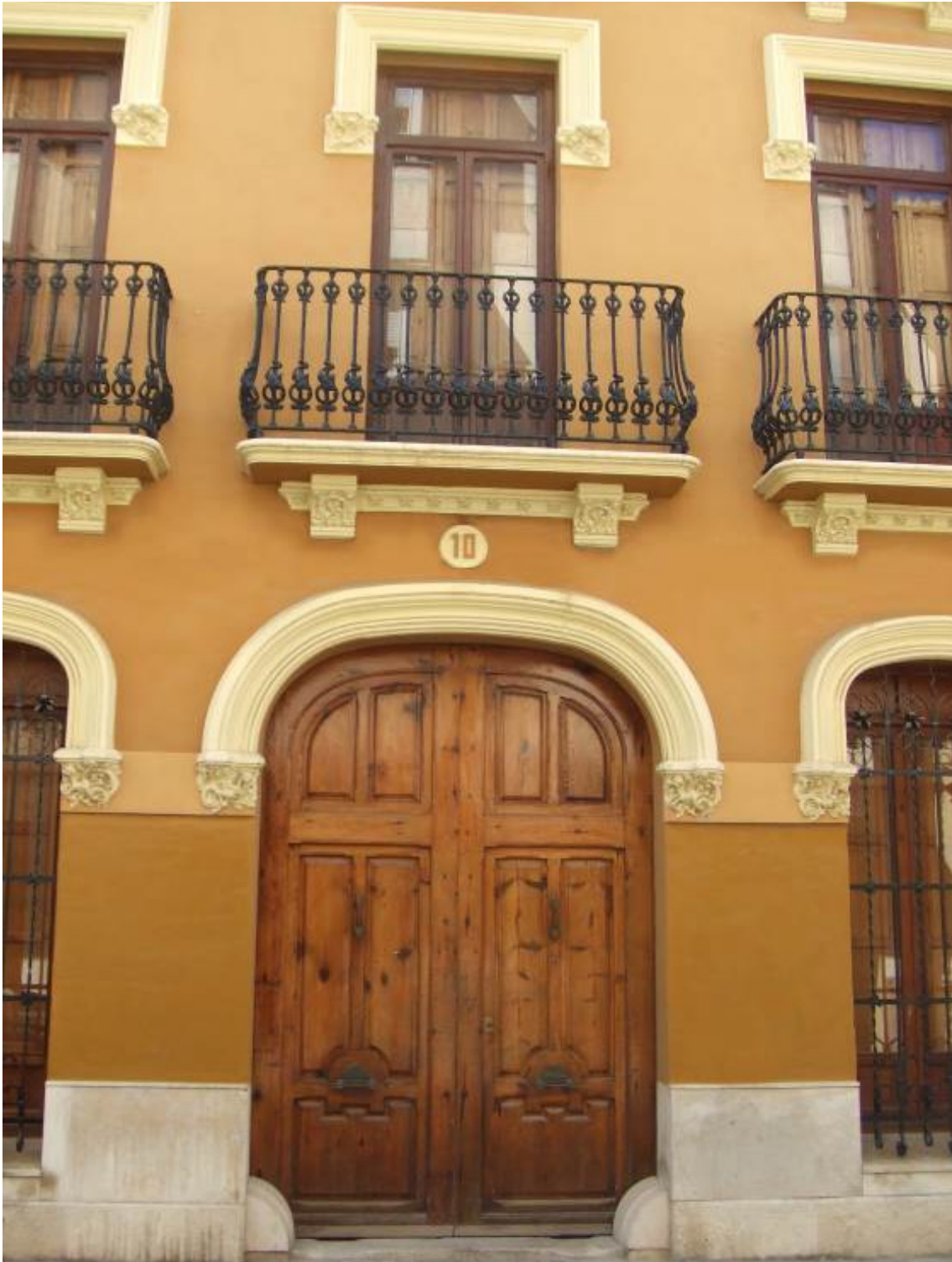
Façana de la casa de Joan Fuster a Sueca