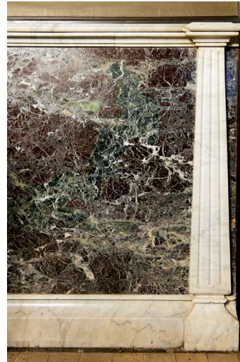
Detall dels arrimadors de marbre del menjador

A tall de conclusió diríem que hem pogut veure com els «estils» tenen encara vigència a l'època del modernisme, amb una voluntat expressiva, d'explicació del caràcter, que s'exhibeix biogràficament en una casa pairal revisitada per les paraules. 16 Una casa-museu no és més que una interpretació d'un espai de rememoració, on el visitant imagina com era l'univers simbòlic de l'habitant. I, en l'experiència de la visita d'aquesta «casa de la vida», 16 hi descobrim els vestigis de l'existència del poeta, com si se'ns convidés a accedir a la seva esfera íntima. No obstant això, el que és cert és que és només un miratge. Davant la impossibilitat de trobar-nos en aquell temps passat, a manera d'homenatge des del present, el que fem és dialogar a través dels objectes amb Maragall, i ens endinsem en una versió significativa del que van ser els seus interiors.