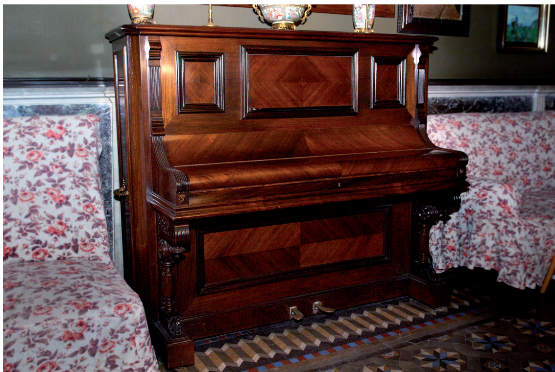
Piano Chassaigne Frères