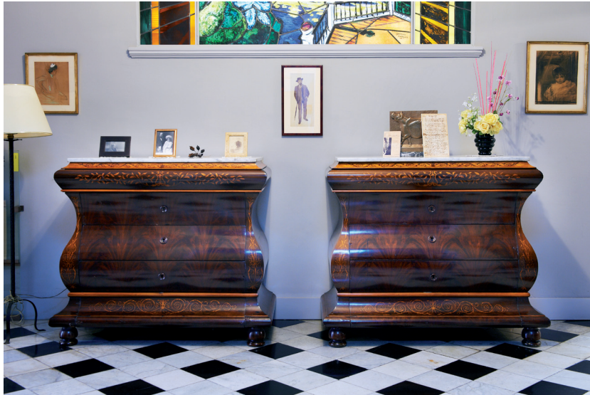
Calaixeres bessones al vestíbul de la Casa Museu Joan Maragall

[...] en les dates a l'entorn del casori, les calaixeres, amb els calaixos oberts a manera d'aparador, eren vestides amb teles fines i mostraven les peces que guardaven al seu interior ben disposades, a manera de mercaderia. De fet era una manera més de mostrar la riquesa de la família. 7