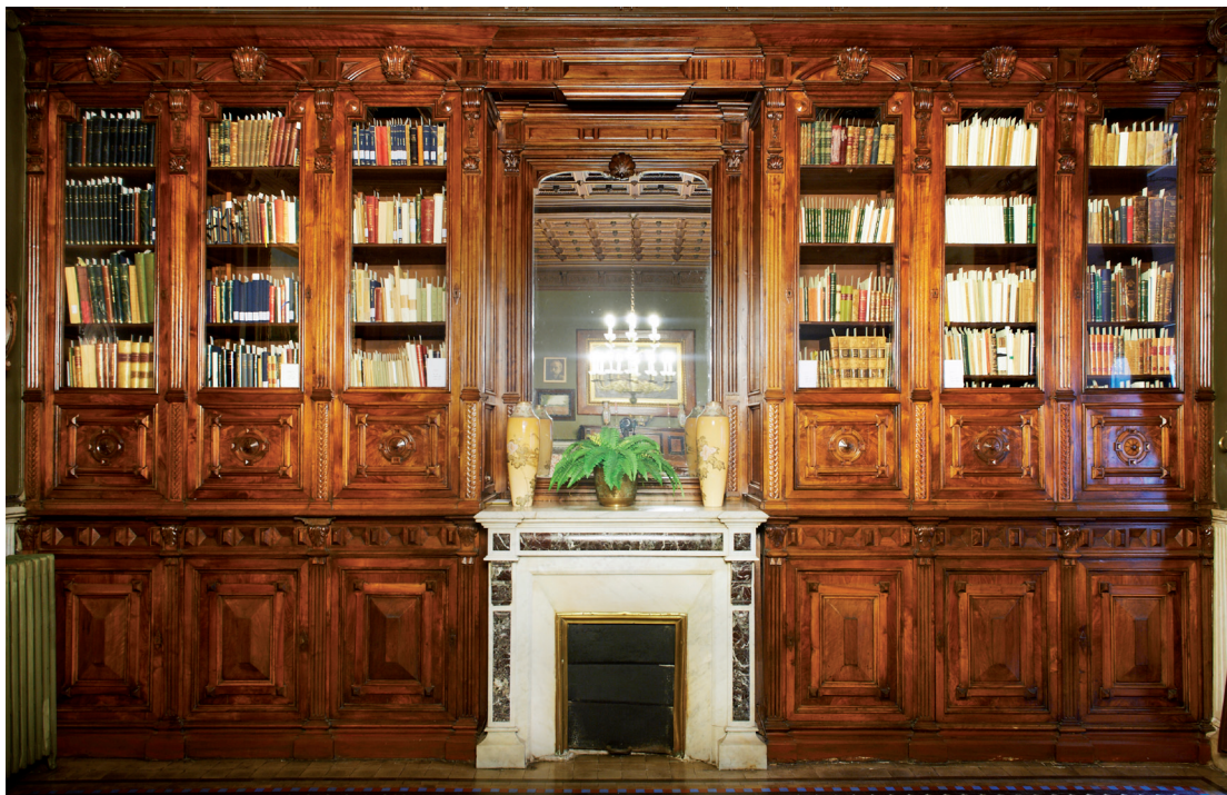
Monumental moble-aparador del menjador