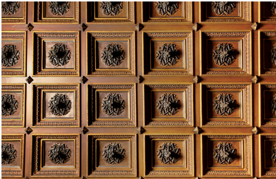
Detall del teginat de fusta tallada amb casetons ornamentals del sostre del menjador

diures amb entapissat de pegamoid , que era molt habitual per la seva practicitat. I en una de les parets, llueix un rellotge modernista que marca simbòlicament l'hora, i que té un pèndol en forma de sol rialler.