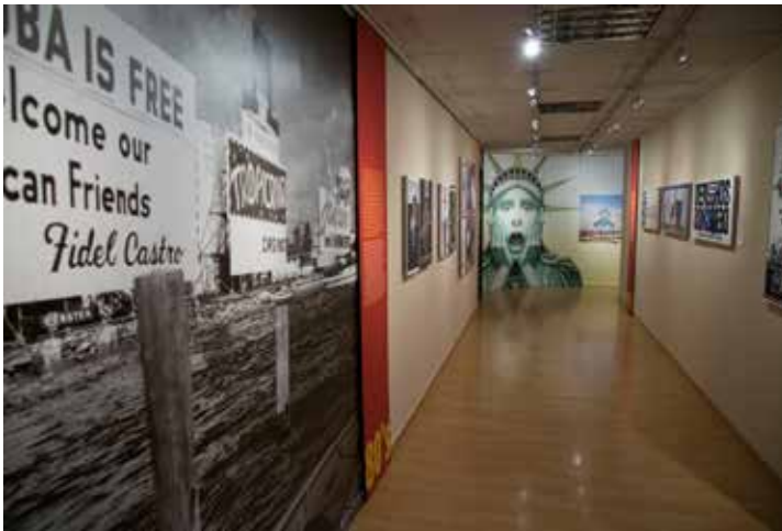
Figura 1. Exposició. Casa Àmerica Catalunya. Autor: José Luis Albero. 2016.