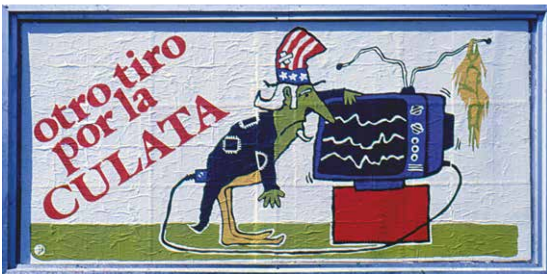
Figura 3. Otro tiro por la culata. Editora Política del Partido Comunista de Cuba. 1990.