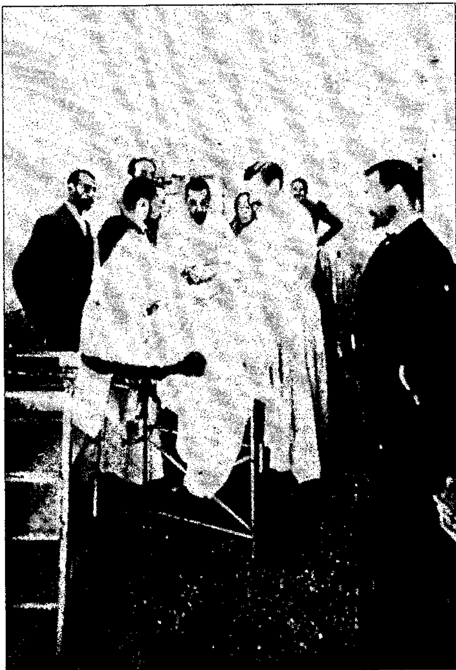
Intervenció quirúrgica efectuada a la primera clínica del doctor Fargas, situada al carrer Hospital de Barcelona