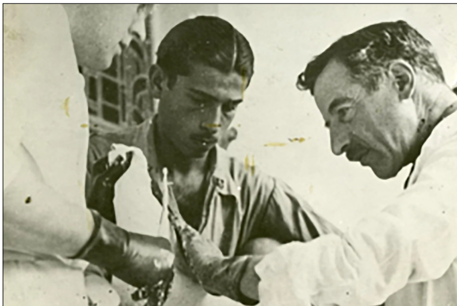
Figura 10. El Dr. Leo Eloesser (a la dreta de la imatge) operant al front de Terol durant la Guerra Civil Espanyola, 1937.

(Font: https://www.brigadasinternacionales.org/2018/07/23/leo-eloesser/ ).