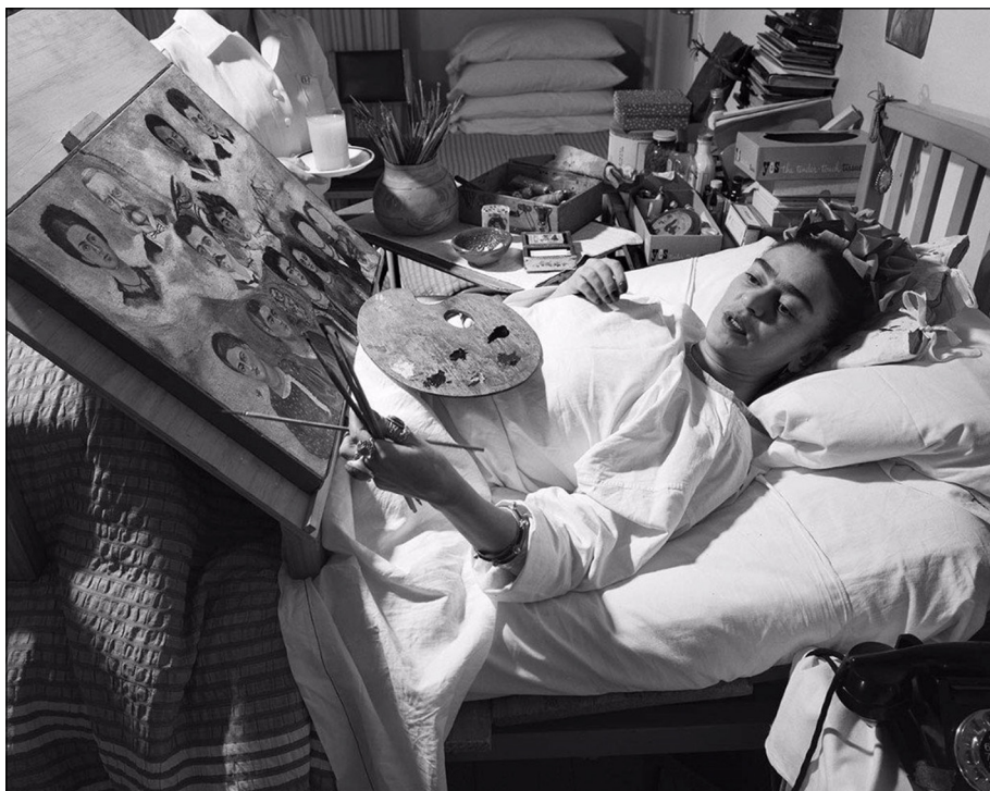
Figura 9. Frida Kahlo a l'habitació de l'Hospital Anglès pintant "Retrato de la familia Frida", 1950.