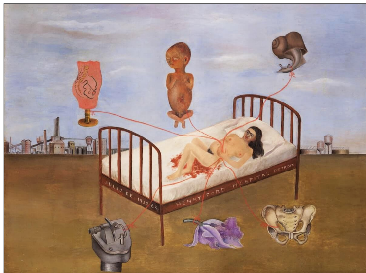
Figura 5. "Henry Ford Hospital", 1932. Oli sobre làmina. (Foto: Museu Dolores Olmedo, Mèxic).