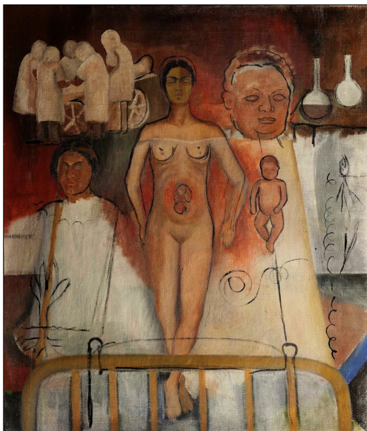
Figura 3. "Frida y la cesárea", 1931. Oli sobre tela.