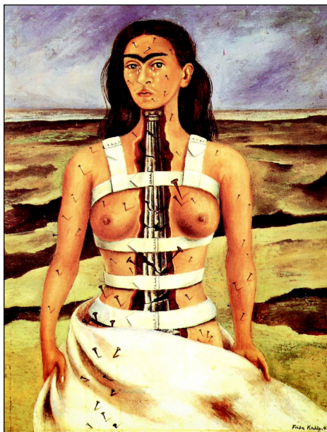
Figura 7. “La columna rota”, 1944. Oli sobre masonita.