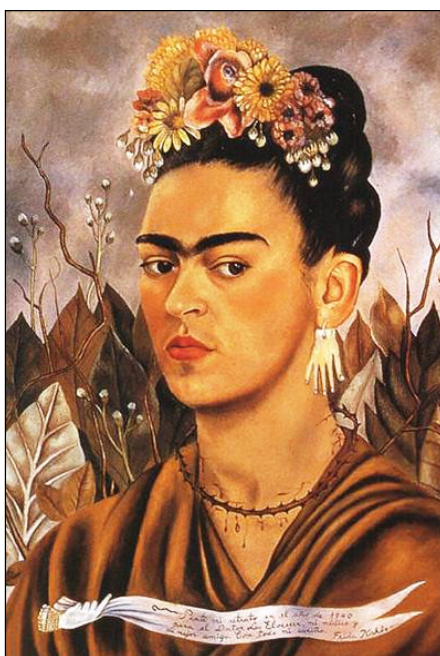
Figura 6. "Autorretrato dedicado al Dr. Eloesser", 1940. Oli sobre masonita. (Foto: Museu Frida Kahlo, Mèxic).