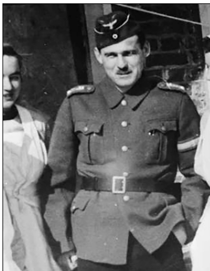
Figura 1. Irmfried Eberl. (Font: http://www.whale.to/b/irmfried_eberl.html ).

El programa d'eutanàsia als hospitals alemanys, anomenat Acció T4, es va erigir com un precedent per a l'Holocaust, ja que era un entrenament per a l'extermini massiu. Fins i tot es van crear les primeres cambres de gas, que es van habilitar als soterranis d'alguns hospitals psiquiàtrics, camuflades com sales de desinfecció. 9 Els metges responsables de la supervisió dels procediments d' eutanàsia als hospitals alemanys també van ser responsables de formular criteris i implementar les primeres etapes de l'aniquilació massiva dels jueus. Com a exemple paradigmàtic, Irmfried Eberl (1910-1948), psiquiatre austríac i director mèdic dels instituts d'eutanàsia de Brandenburg, va ser el primer comandant del camp d'extermini de Treblinka (Figura 1). 10