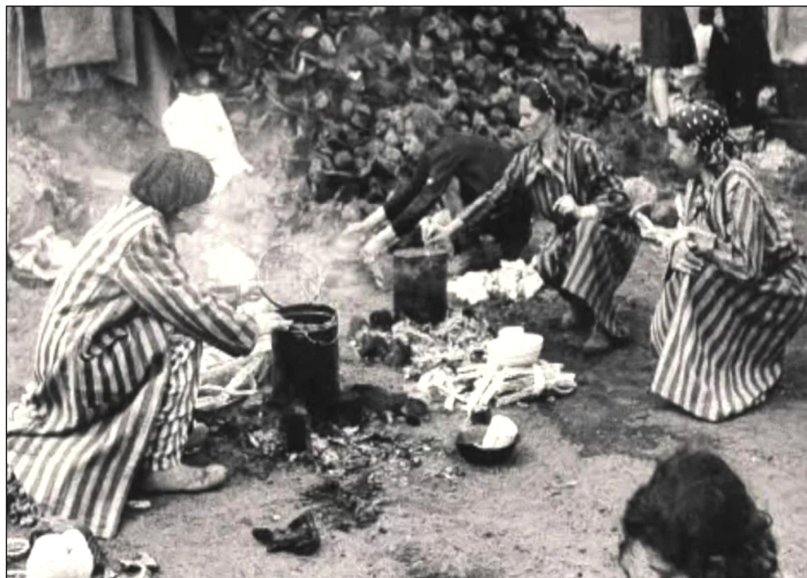
Figura 6. Dones rentant draps per a ser reutilitzats com a material d'higiene íntima. (Font: https://qrios.it/menstruazioni-durante-olocausto-questa-donna/1730/ ).

Després de l'alliberament, la majoria de les dones que van patir amenorrea durant el confinament dels camps de concentració van començar a tornar a menstruar. El retorn de les menstruacions va ser motiu d'alegria, ja que es va convertir en un símbol de llibertat.