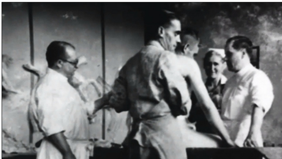
Figura 7. Carl Clauberg al Bloc 10 d'Auschwitz. (Font: https://mubi.com/es/films ).