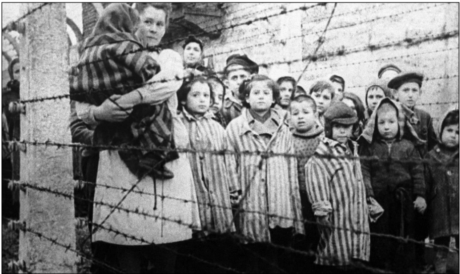
Figura 4. Segona Guerra Mundial. Polònia. 27 de gener de 1945. Nens supervivents després de l'alliberament del camp de concentració alemany d'Auschwitz per part de les tropes soviètiques.