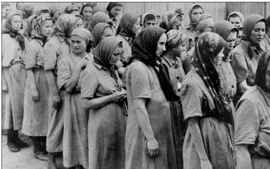
Figura 2. Dones embarassades a Auschwitz.