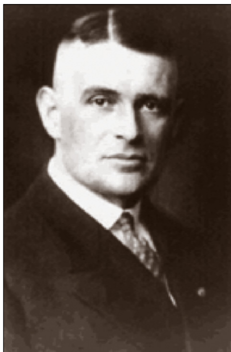
Figura 9. Herman Stieve..

Hermann Stieve, mitjançant cossos de la presó de Plötzensee va poder demostrar que l'estrès crònic d'una amenaça de mort o una execució imminent conduïa a marcades alteracions morfològiques i canvis degeneratius en els ovaris en la majoria de les dones posteriorment executades. També es va trobar amb el que va anomenar " Schreckblutungen " (literalment, sagnat de xoc), és a dir, sagnat uterí anormal causat per un desencadenant purament mental, en aquest cas generalment l'anunci de l'execució. Aquestes troballes van portar Stieve a proposar el que avui s'anomenaria un efecte psicosomàtic i a plantejar hipòtesis sobre una influència directa dels nervis autònoms en els ovaris (Figura 9).