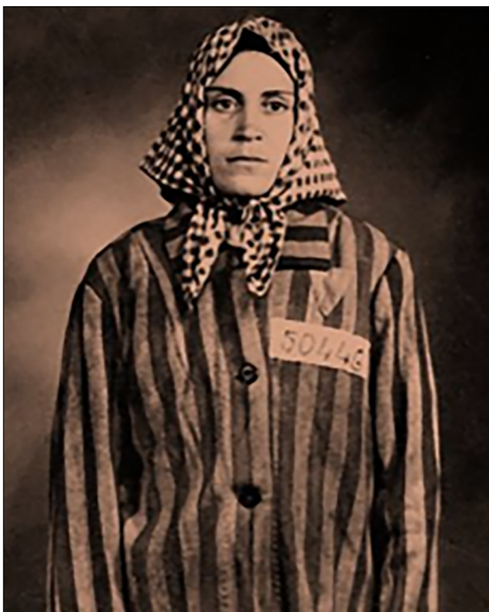
Figura 5. Neus Català al camp d’extermini de Ravensbrück. 1944. (Font: Wiquipedia).

En aquest apartat es descriuen aspectes relacionats amb la salut sexual de la dona i l’atenció ginecològica a la qual van ser sotmeses les internes.