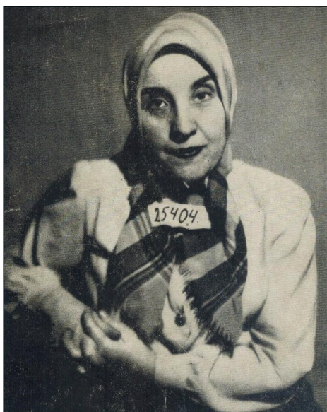
Figura 3. La ginecòloga Gisella Perl, sobrevivent d'Auschwitz, va ajudar altres dones a preservar la vida en interrompre les seves gestacions. (Font: Wikipedia).