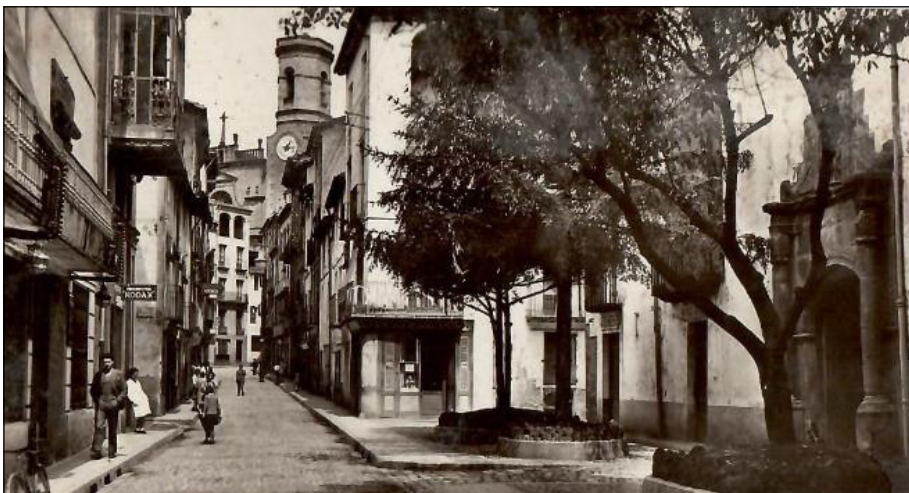
Figura 2. Carrer de Sant Rafael i façana de l'antic Hospital de Sant Jaume d'Olot.